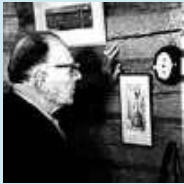
К.Г. ПАУСТОВСКИЙ В КАБИНЕТЕ ТАРУСОВСКОГО ДОМА