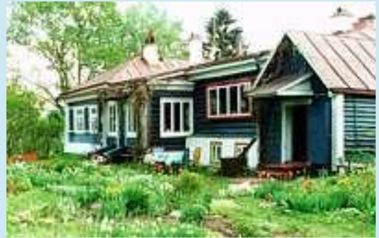
ДОМ- МУЗЕЙ ПАУСТОВСКОГО В ТАРУСЕ