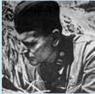
К.Г. ПАУСТОВСКИЙ НА ФРОНТЕ, 1915 Г.

Сын инженера-путейца. Учился в Киевском, затем в Московском университетах. Был рабочим на металлургических заводах в Юзовке, Екатеринославе, Таганроге, кондуктором трамвая в Москве; во время империалистической войны был санитаром, матросом, репортером и редактором газет.