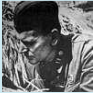
К.Г. ПАУСТОВСКИЙ НА ФРОНТЕ, 1915 Г.

Сын инженера-путейца. Учился в Киевском, затем в Московском университетах. Был рабочим на металлургических заводах в Юзовке, Екатеринославе, Таганроге, кондуктором трамвая в Москве; во время империалистической войны был санитаром, матросом, репортером и редактором газет.