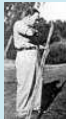
К.Г. ПАУСТОВСКИЙ НА РЫБАЛКЕ