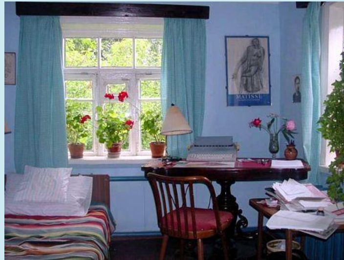
КОМНАТА В ТАРУСОВСКОМ ДОМЕ