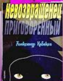
Александр Кабаков Невозвращенец