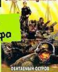
Братья Стругацкие Обитаемый остров