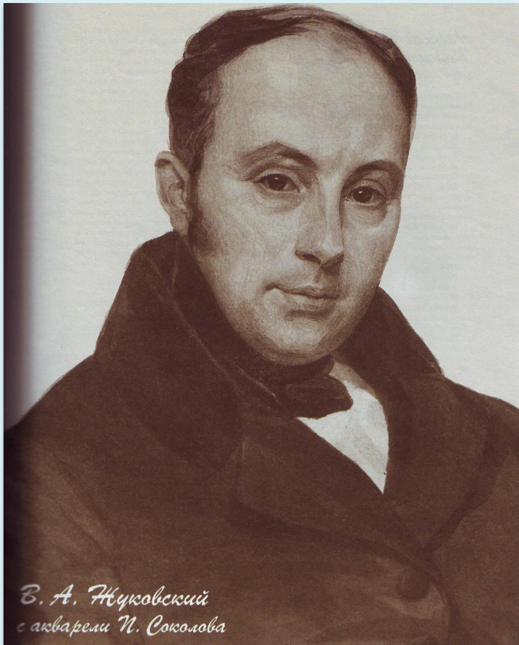
В. А. Жуковский с акварели Н. Соколова