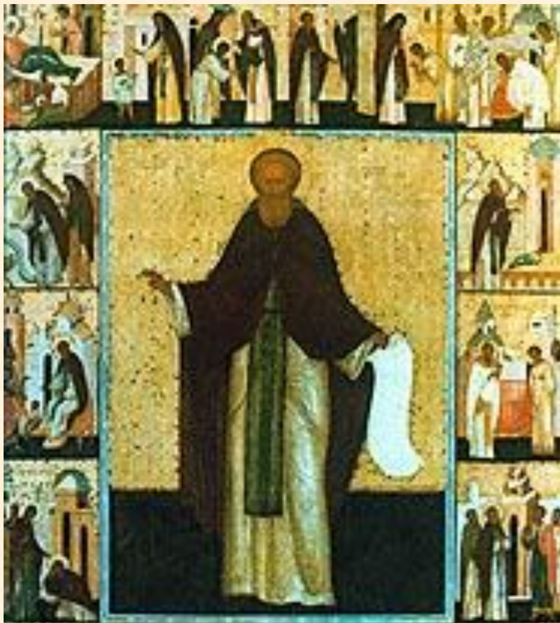
Дионисий. Деяния Сергия Радонежского. Икона из Успенского собора в Дмитрове. Вторая половина 15 века.