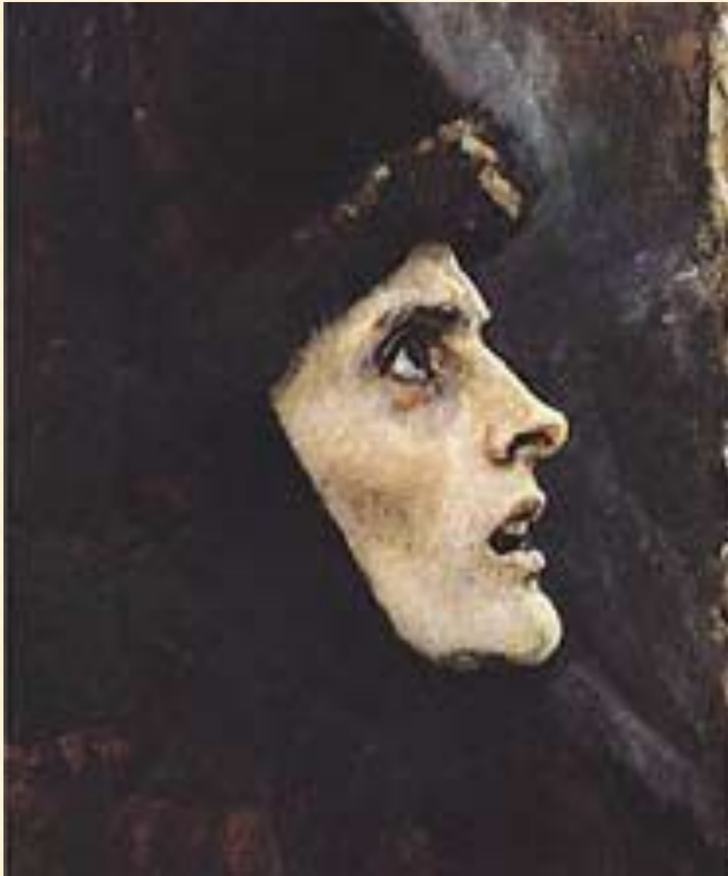
В. И. Суриков. Голова боярыни Морозовой. 1886 год.