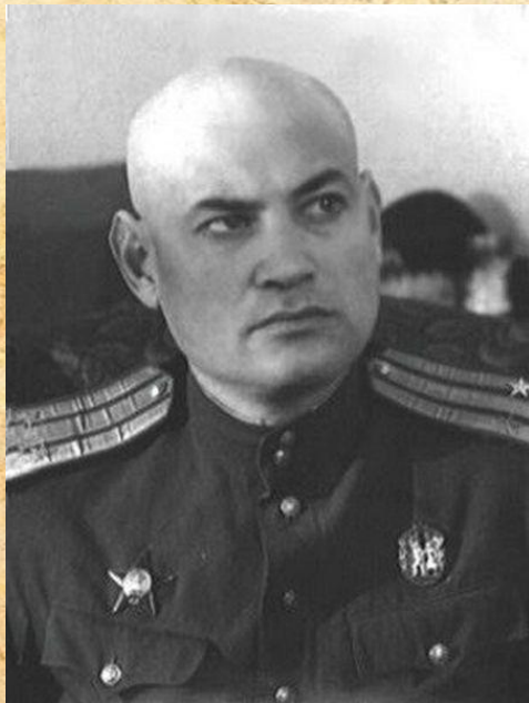
Борис Леонтіївич Горбатов (1908-1954)

Борис Леонтіївич Горбатов народився у 1908 році на Петромарьевском руднику в Донбасі. Вперше виступив у пресі в 1922 році. Співатор сценаріїв телефільмів «Це було в Донбасі», «Нескорені» і «Донецькі шахтарі», один з творців об'єднання пролетарських письменників Донеччини «Забой», батько знаменитого роману «Донбас». Більшу частину життя провів у Москві, де й похований на Новодівичому кладовищі. Але і в нашому краї, а саме в Артемівську (тоді — Бахмут) — провів чимало часу. Тут Борис Леонтіївич закінчив школу, знайшов своє покликання, почав друкуватися. В 14 років він уже був робкорів губернської «Кочегарки». Деякий час працював строгальщиком по металу на Краматорському заводі, а потім з головою пішов у журналістику. Перші повісті і роман («Наш місто») Горбатов створив на донецькій землі. Зв'язків з шахтарським краєм не поривав до останніх днів свого життя. Помер у 1954 році.