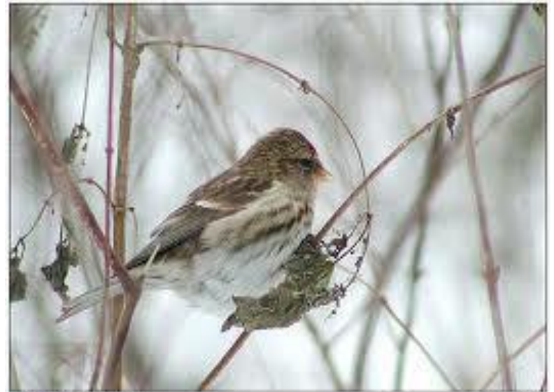
Горнозёмка (Acanthis fanninxi) M. Zolotareva