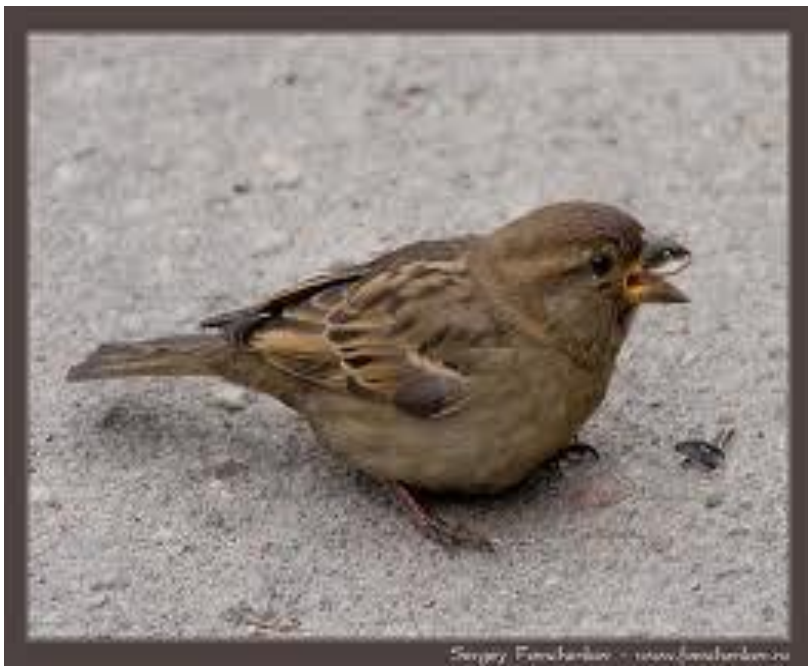
Sergey Fomchenkov - www.fomchenkov.ru