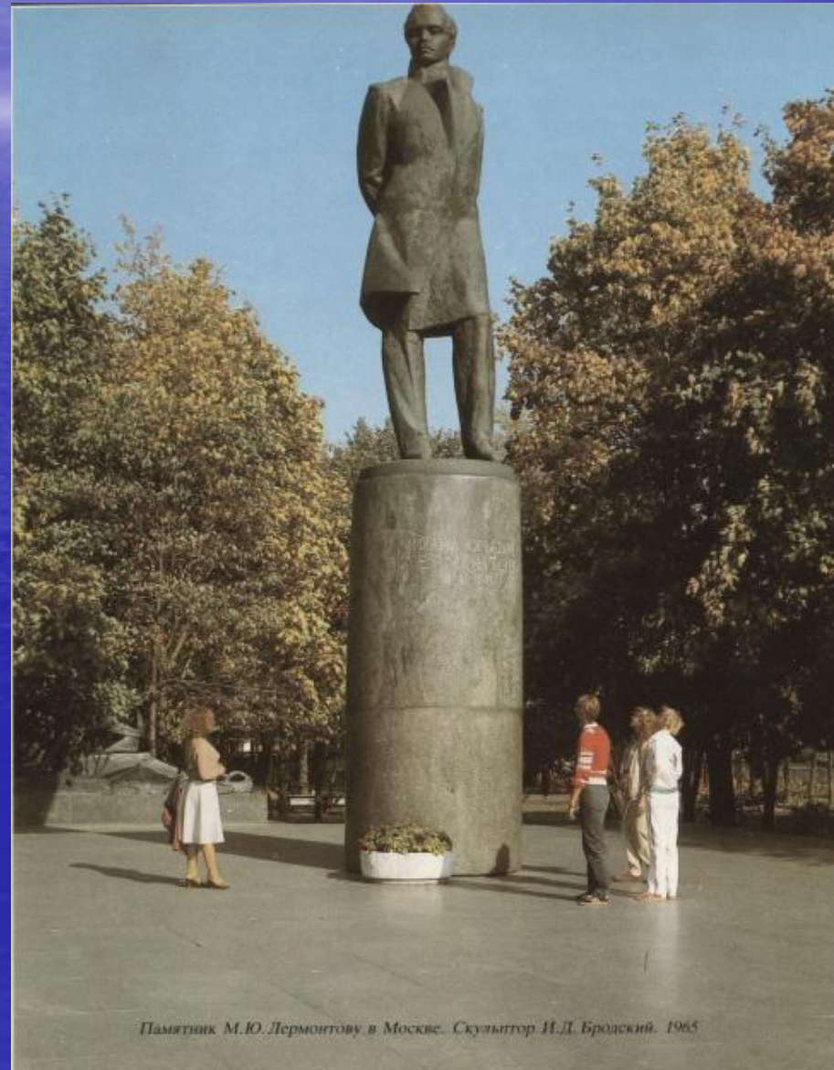
Памятник М.Ю. Лермонтову в Москве. Скульптор И.Д. Бродский. 1965