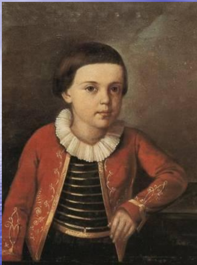
М. Ю. Лермонтов в детстве.