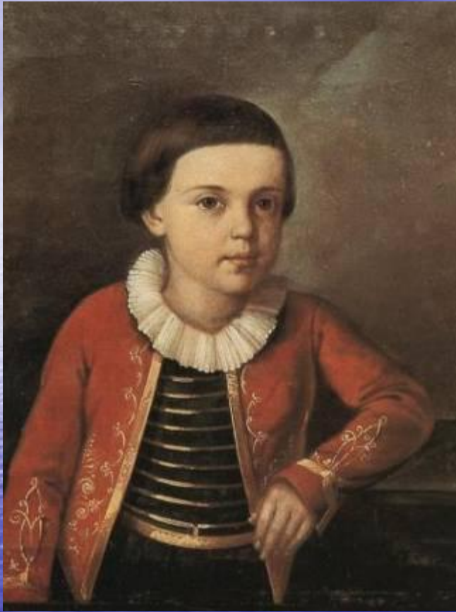
М. Ю. Лермонтов в детстве.