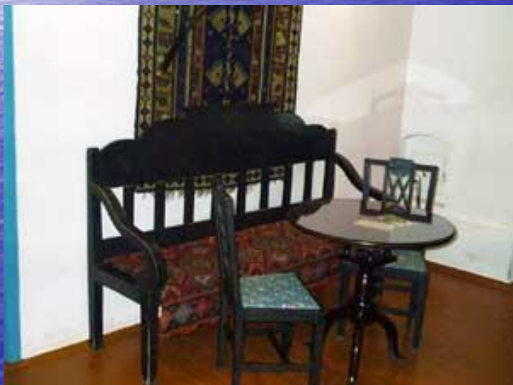
Стол, за которым работал Лермонтов