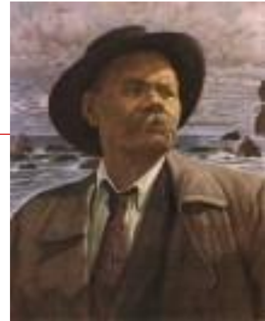
Бродский И.И. 1937

Любите книгу, она облегчит вам жизнь....она научит вас уважать человека и самих себя, она окрыляет ум и сердце чувством любви к миру, к человеку.