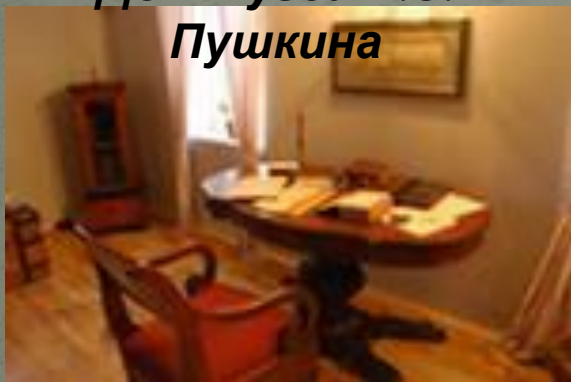
Рабочий кабинет Пушкина