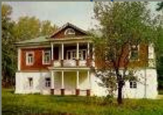
Дом-музей А.С. Пушкина