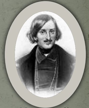
Николай Васильевич Гоголь