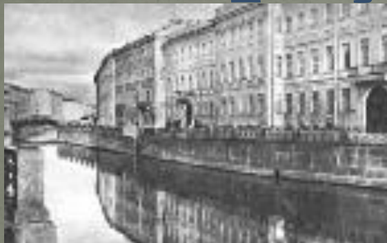
Набережная р. Мойки, д.12