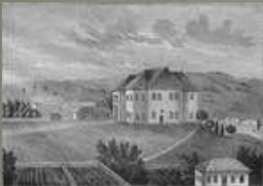
Дом А.С. Пушкина в Кишинёве