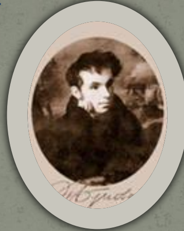
Василий Андреевич Жуковский

В то лето Пушкин много работал, читал свои произведения жене и друзьям. Они с Жуковским устроили что-то вроде творческого соревнования. Жуковский написал «Сказку о царе Берендее», а Пушкин свою «Сказку о царе Салтане, о сыне его славном и могучем богатыре князе Гвидоне Салтановиче и о прекрасной царевне Лебеди»