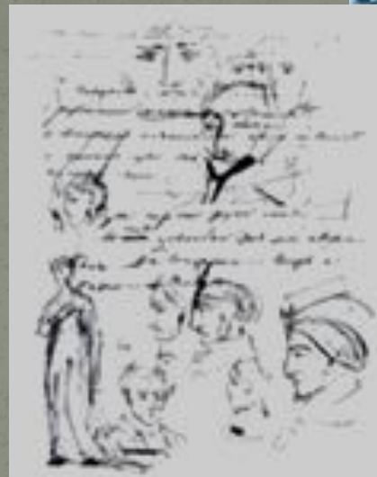
Страница из первой кишиневской тетради

Пушкина В Кишиневе Пушкин прожил три года – с 1820-го по 1823-й. Здесь им были написаны поэмы «Кавказский пленник», «Бахчисарайский фонтан», «Братья разбойники». В Кишиневе был начат роман «Евгений Онегин»