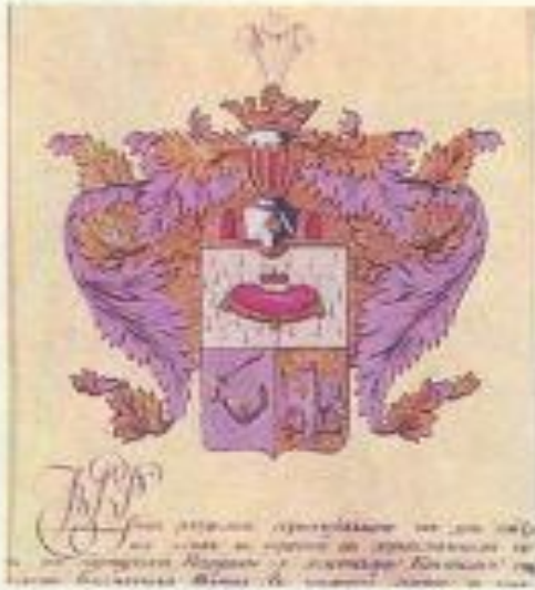
Фамильный герб Пушкиных

Пушкин легко покинул стены родного дома и ни разу в стихах не упомянул ни матери, ни отца. Упоминания же дяди Василия Львовича скоро стали откровенно ироническими. И при этом он не был лишен родственных чувств: брата и сестру он нежно любил всю жизнь, самоотверженно им помогал, сам находясь в стесненных материальных обстоятельствах, неизменно платил безо всякого ропота немалые долги брата Левушки, которые тот делал по-отцовски беспечно и бессовестно переваливал на Пушкина. Да и к родителям он проявлял больше внимания, чем они к нему. Тем более бросается в глаза, что, когда в дальнейшем Пушкин хотел оглянуться на начало своей жизни, он неизменно вспоминал только Лицей — детство он вычеркнул из своей жизни. Он был человек без детства.