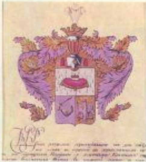
Фамильный герб Пушкиных