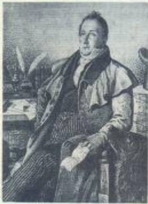
С. Я. Пушкин

Пушкин легко покинул стены родного дома и ни разу в стихах не упомянул ни матери, ни отца. Упоминания же дяди Василия Львовича скоро стали откровенно ироническими. И при этом он не был лишен родственных чувств: брата и сестру он нежно любил всю жизнь, самоотверженно им помогал, сам находясь в стесненных материальных обстоятельствах, неизменно платил безо всякого ропота немалые долги брата Левушки, которые тот делал по-отцовски беспечно и бессовестно переваливал на Пушкина. Да и к родителям он проявлял больше внимания, чем они к нему. Тем более бросается в глаза, что, когда в дальнейшем Пушкин хотел оглянуться на начало своей жизни, он неизменно вспоминал только Лицей — детство он вычеркнул из своей жизни. Он был человек без детства.