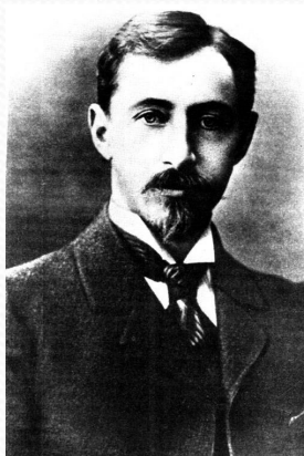
Иван Андреевич Бунин