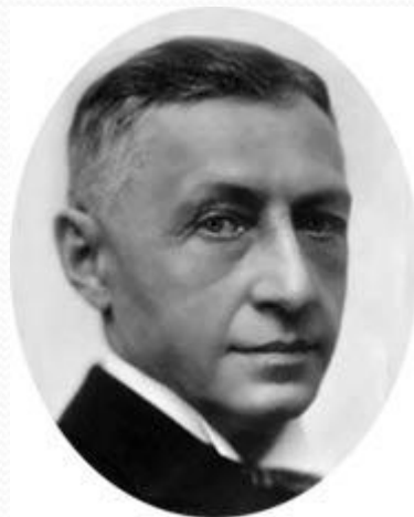
Алексей Николаевич Апухтин