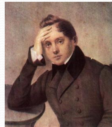
Евгений Абрамович Баратынский