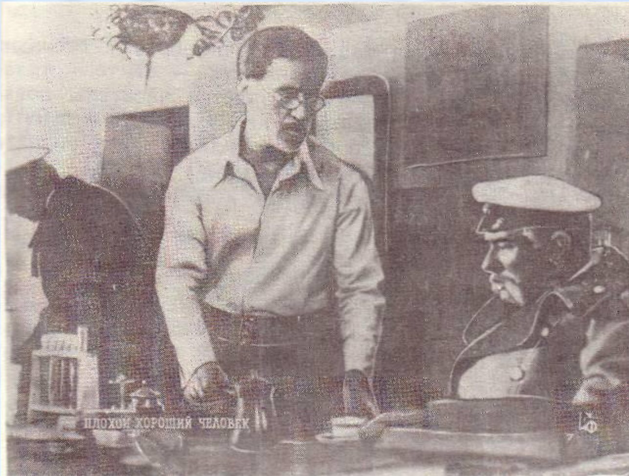
Кадр из кинофильма «Плохой хороший человек» Мосфильм. В роли фон Корена В.Высоцкий.