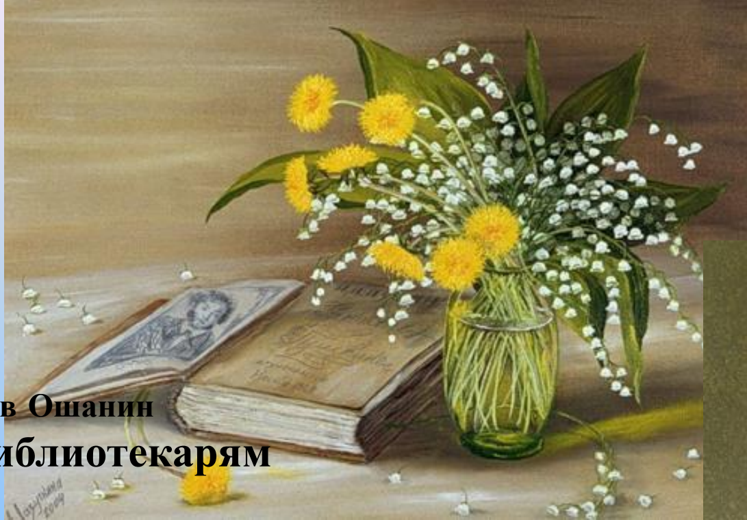
Лев Ошанин Библиотекарям

Книжные люди, друзья мои ближние, Верные слуги и маршалы книжные. Милые тихоголосые женщины, В книгах - всеведущи, в жизни - застенчивы. Душ человеческих добрые лекари, Чувств и поступков библиотекари. Кажется вы мне красивыми самыми, Залы читален мне видятся храмами. Кто мы без вас? Заплутавшие в замети Люди без завтра и люди без памяти