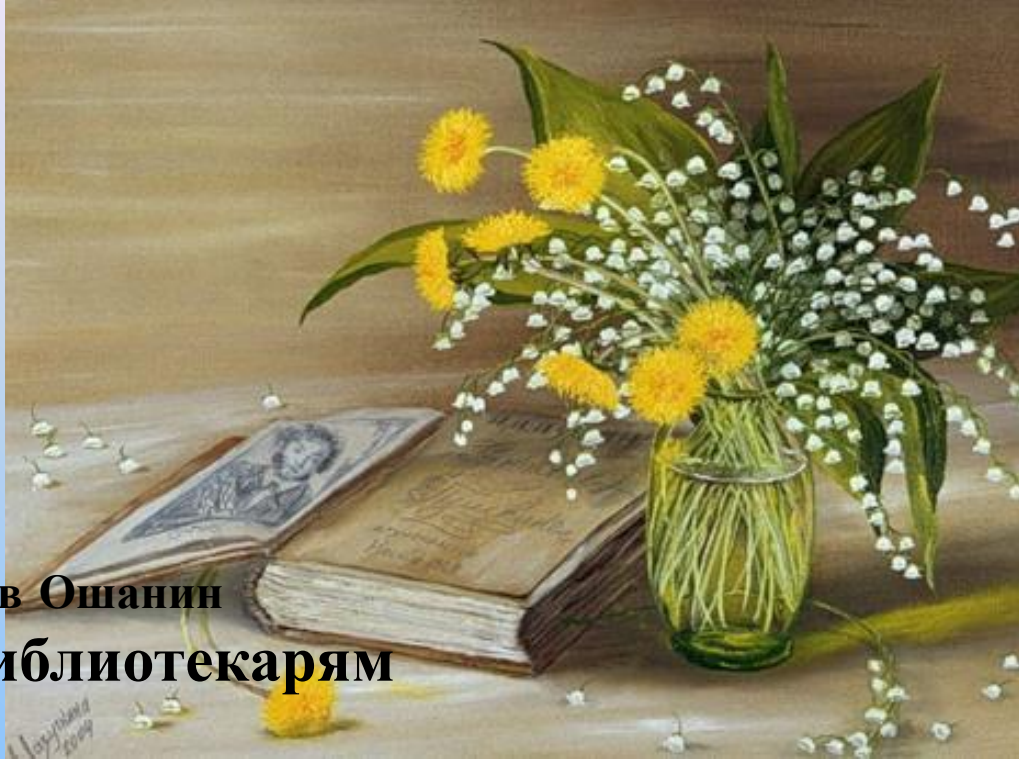
Лев Ошанин Библиотекарям

Книжные люди, друзья мои ближние, Верные слуги и маршалы книжные. Милые тихоголосые женщины, В книгах - всеведущи, в жизни - застенчивы. Душ человеческих добрые лекари, Чувств и поступков библиотекари. Кажется вы мне красивыми самыми, Залы читален мне видятся храмами. Кто мы без вас? Заплутавшие в замети Люди без завтра и люди без памяти