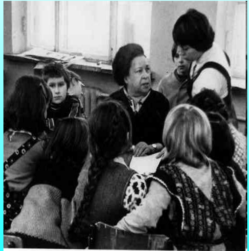
Агния Барто с учащимися школы. 1978 г.