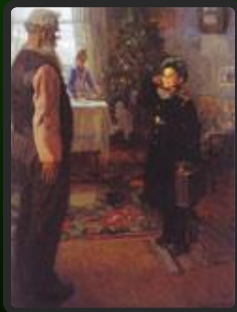
Прибыл на каникулы.