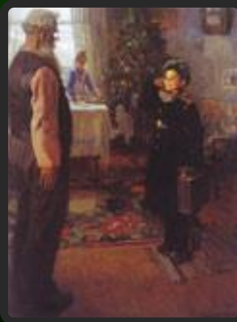
Прибыл на каникулы.