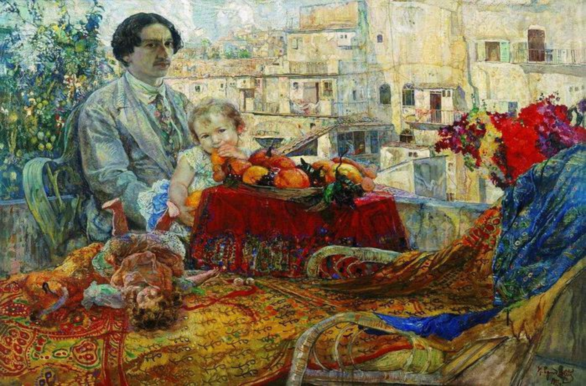
«Автопортрет с дочерью»