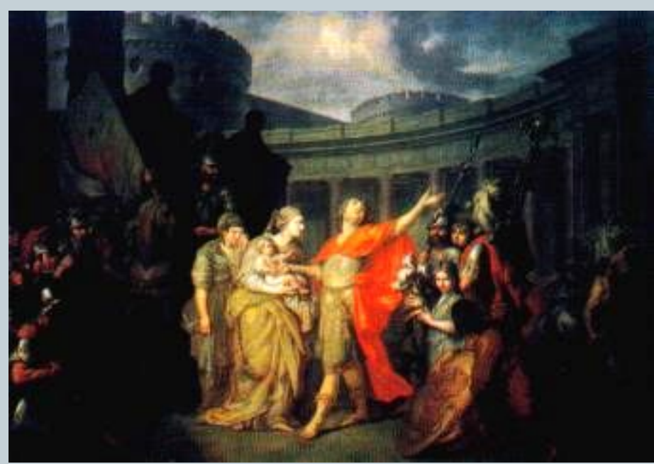
Прощание Гектора с Андромахой

Могучий Гектор, защитник Трои, вернулся ненадолго в свой город, « чтобы увидеть домашних, жену дорогую и сына».