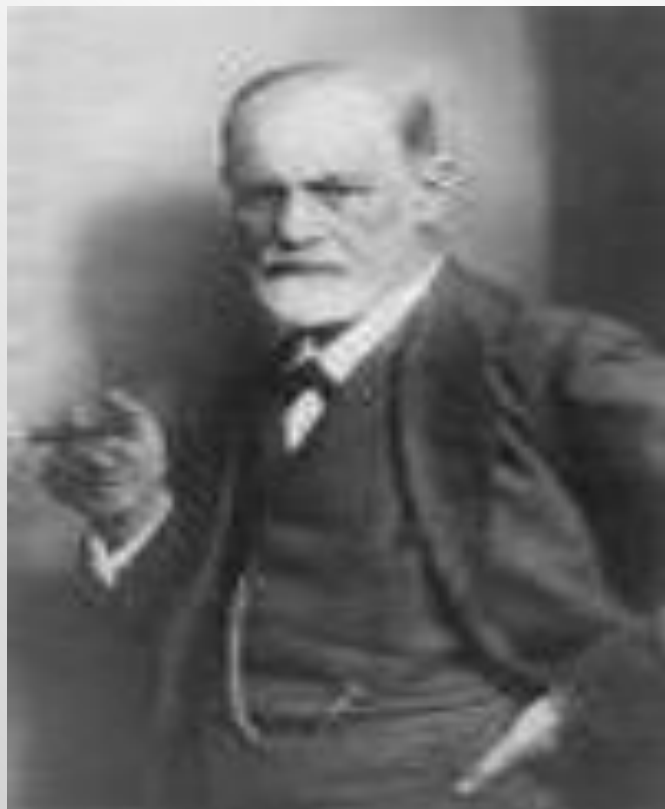
Афанасий Неофитович Шеншин