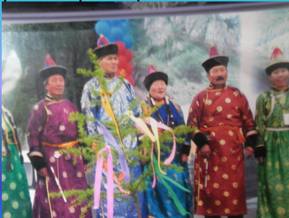
Фольклорный ансамбль «Мэлэ»