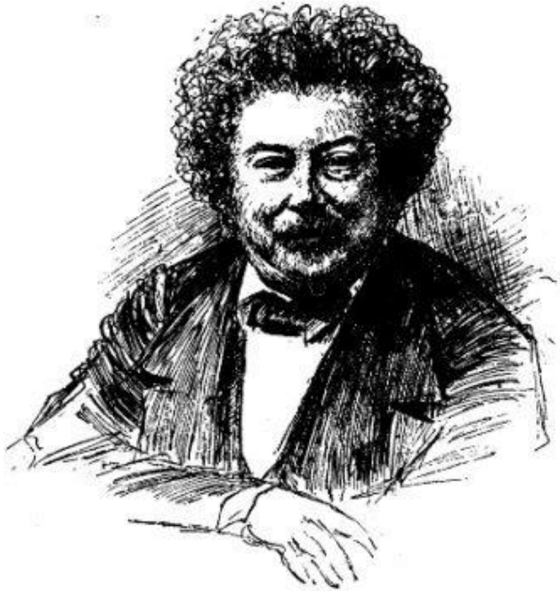
Alexandre Dumas père.