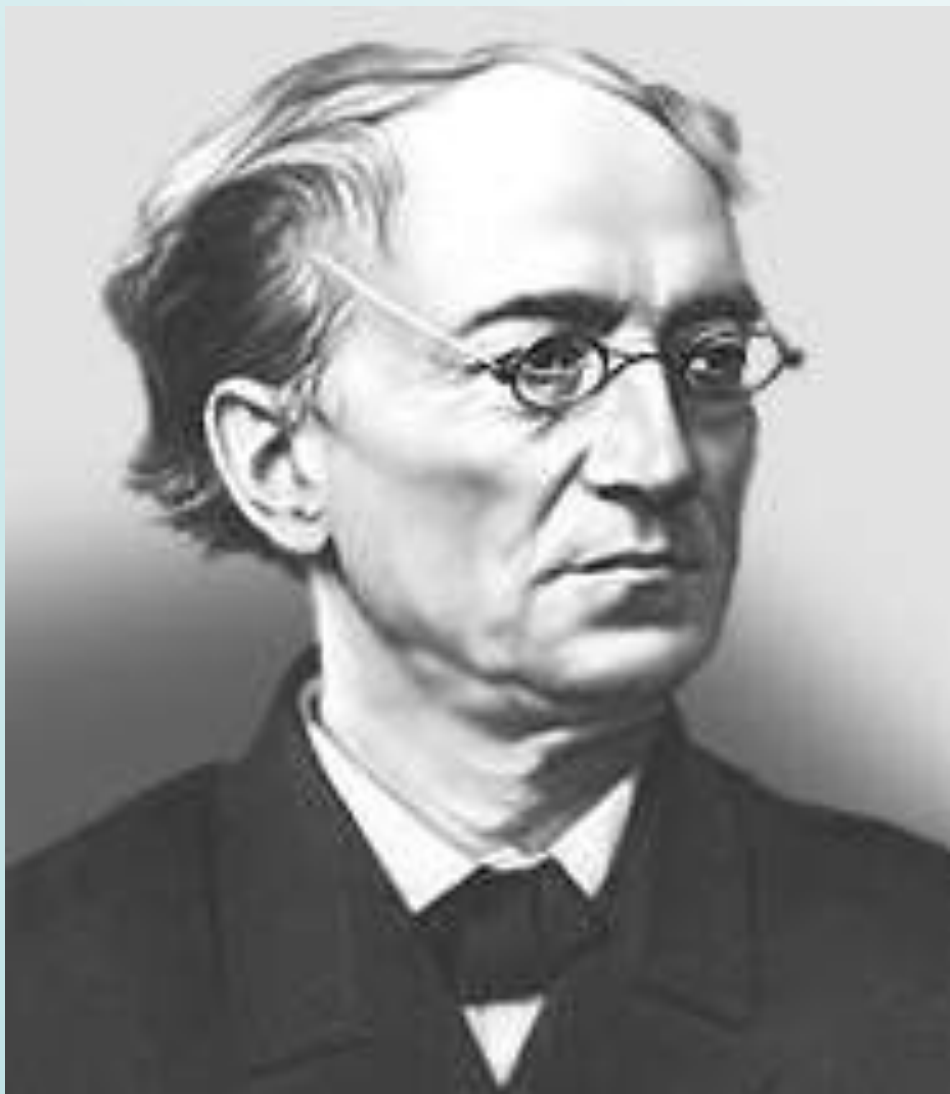
Тютчев Фёдор Иванович