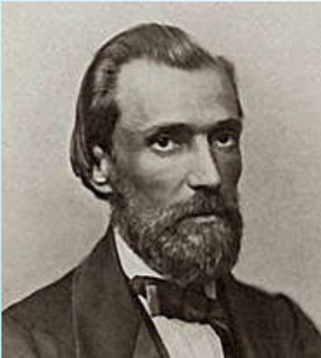
НИКИТИН Иван Саввич