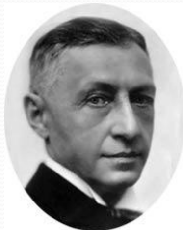
Алексей Николаевич Апухтин