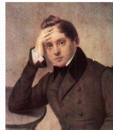
Евгений Абрамович Баратынский