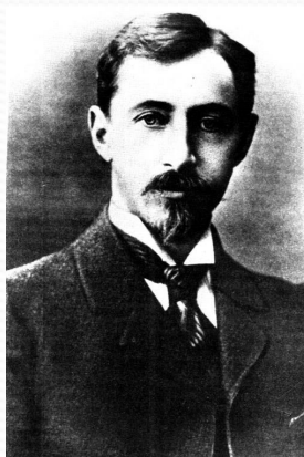
Иван Андреевич Бунин