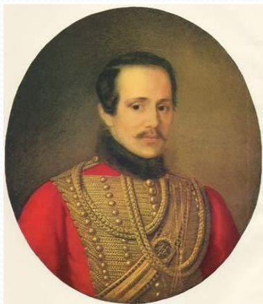
Михаил Юрьевич Лермонтов