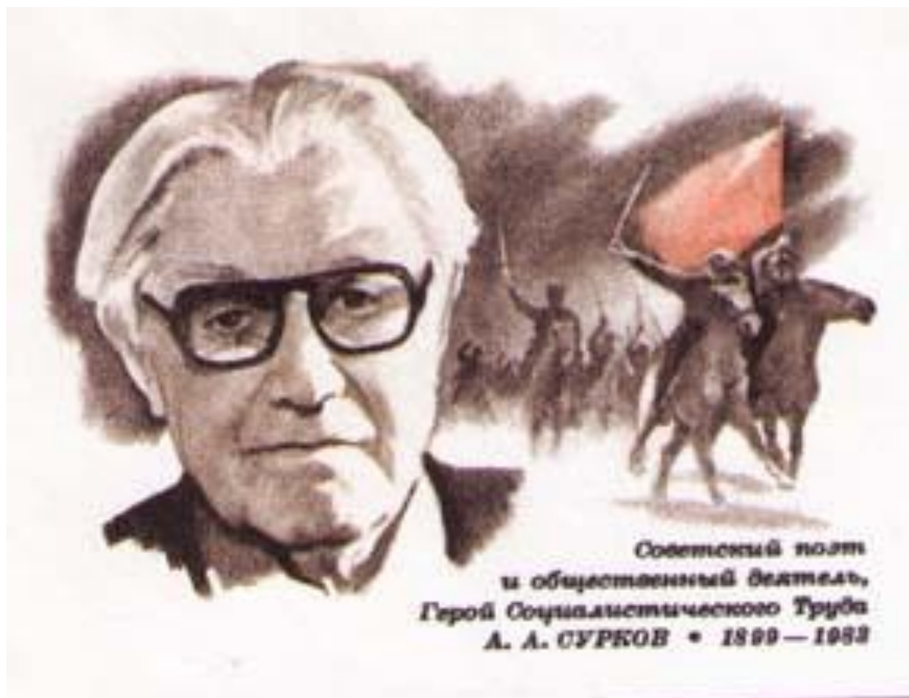
Советский поэт и общественный деятель, Герой Социалистического Труда А. А. СУРКОВ • 1899 — 1983