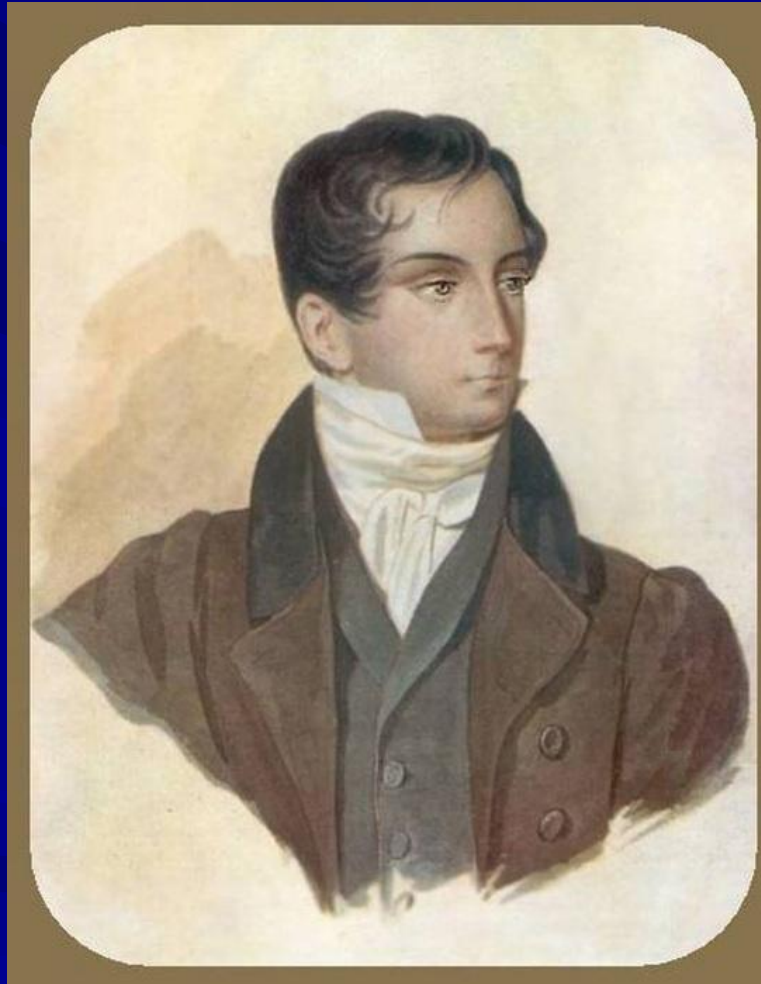
портрет работы А. Агрене 1826 г.