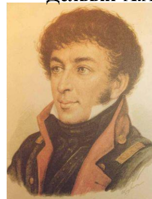
К. Н. Батюшков