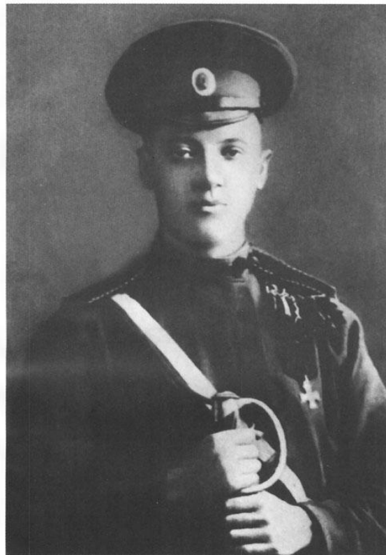
Николай Гумилёв в форме уланского полка. 1914—1915.