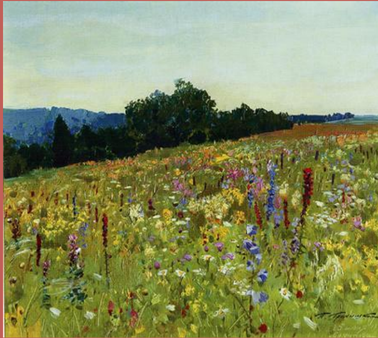
П.М. Гречишкин. Поляна Бучинка, 1959 г

Солончаки. Вихры полыни сивые да коршунов ленивые виражи... Скажи мне, степь, ну что в тебе красивого на чем тут глазу отдохнуть, скажи? Быть может, эти жилистые донники тебя преображают по весне, когда ветров серебряные дольники звучат на зеленеющей волне? Эх, степь родная, воля ястребиная, росы алмазный высверк под лучом. Но красота твоя неистребимая живет в душе, и весны ни при чем.