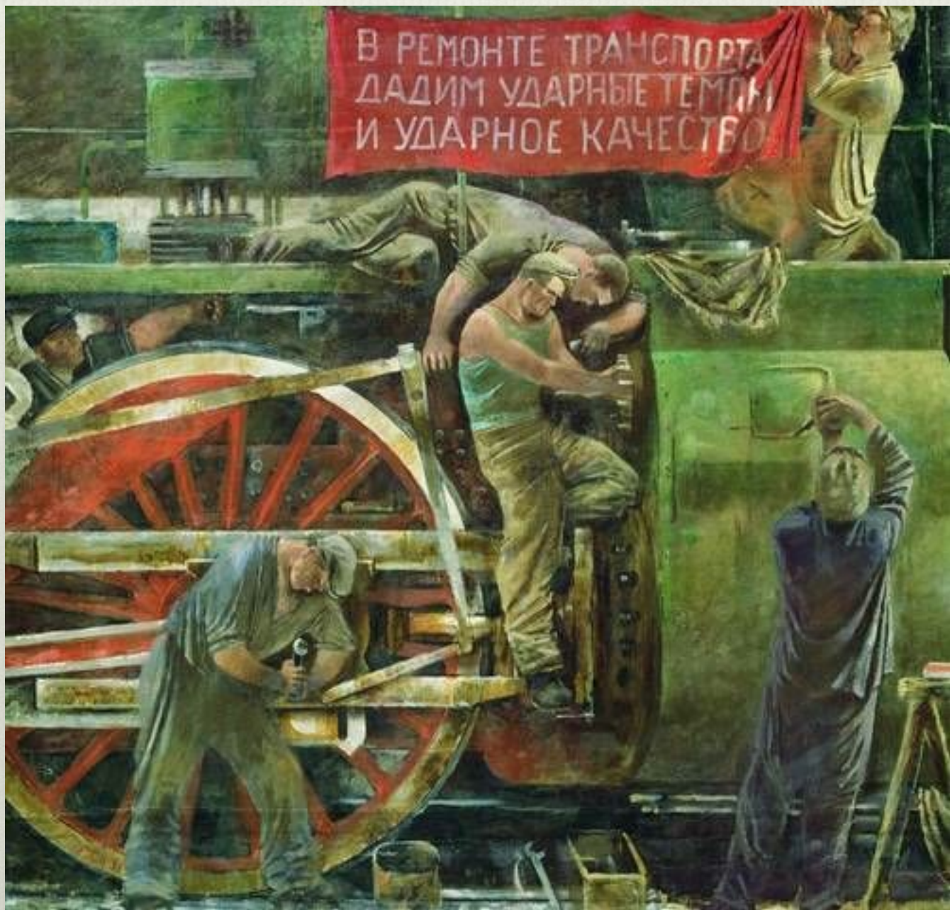
А.Самохвалов. Ремонт паровоза. 1931 г.