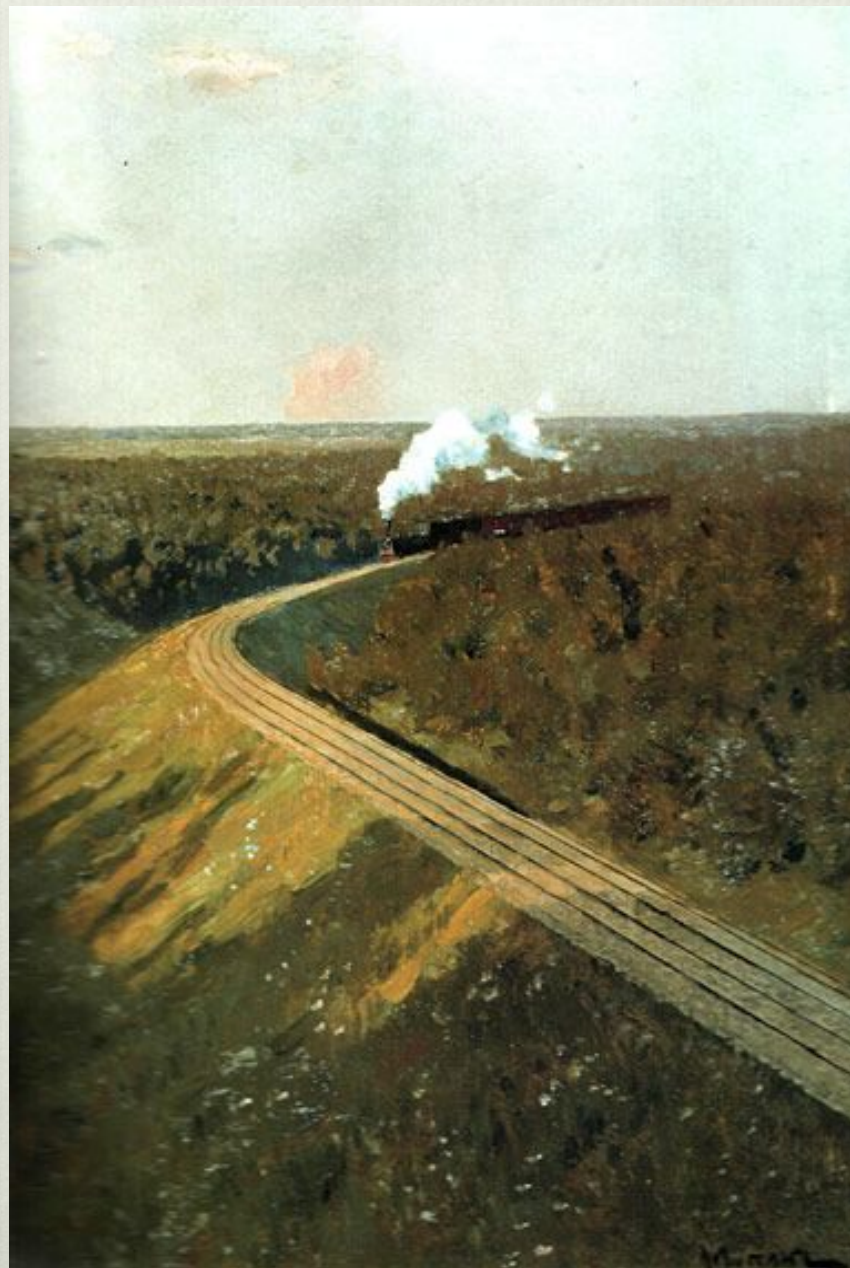
Н.Ярошенко. Всяду жизнь. И. Левитан. Поезд в пути