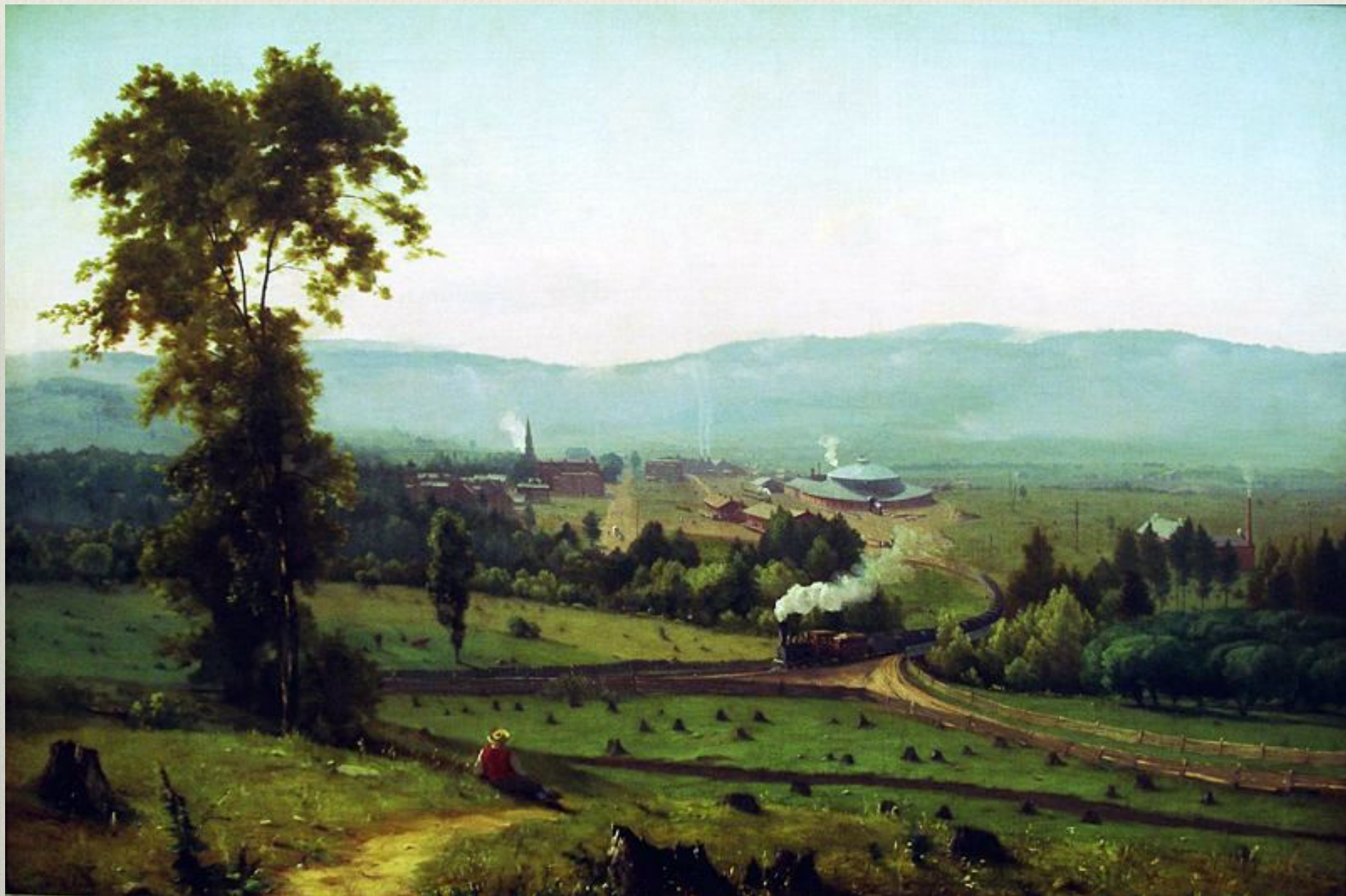
Дж.Иннесс. Долина Лакаванна. 1855