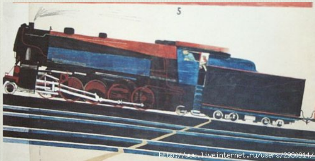
А.Дейнека. Паровоз. 1930-1931 г.