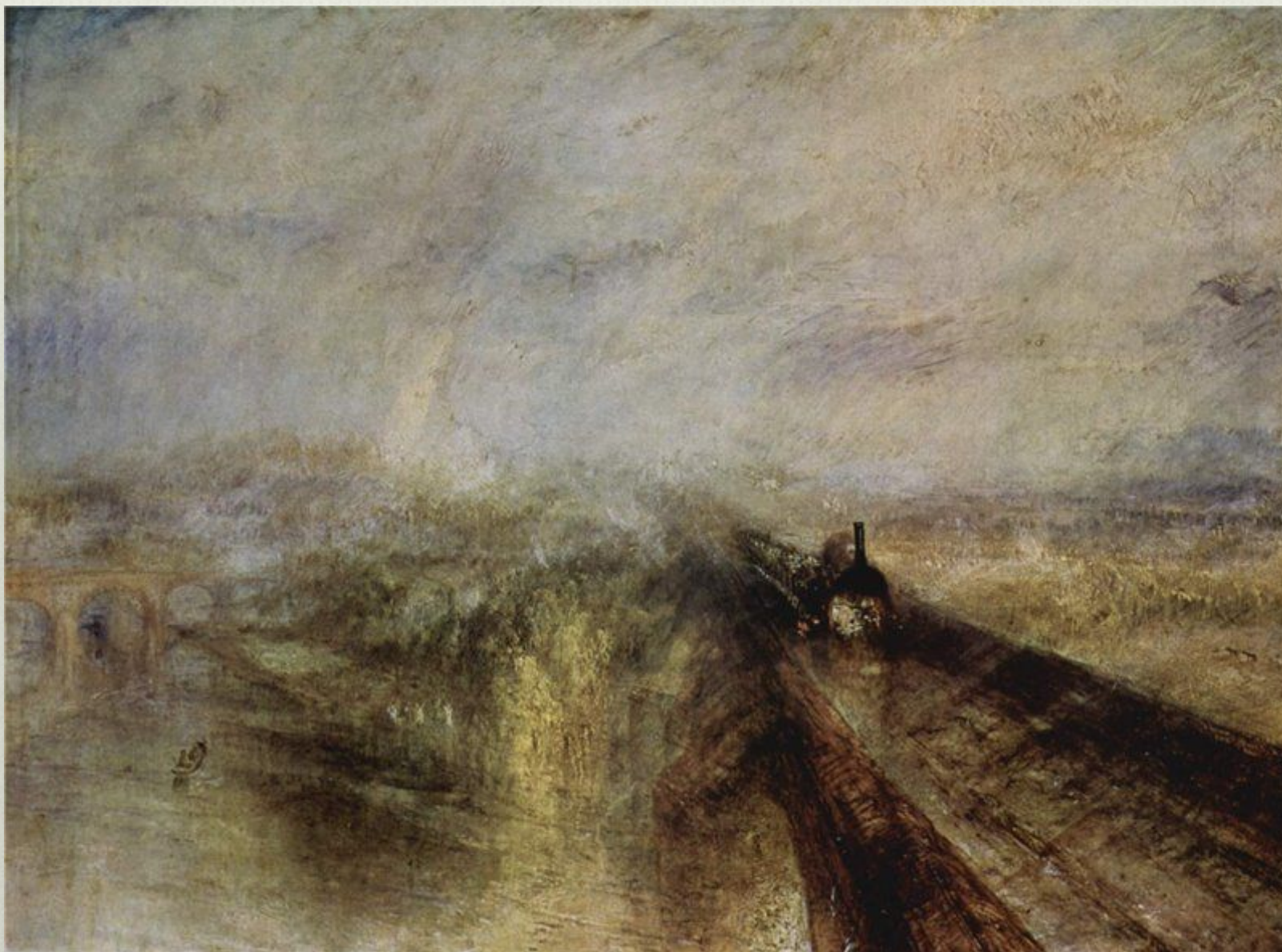
У. Тёрнер. Дождь, пар и скорость. Паровоз Грейт Вестерн. 1844