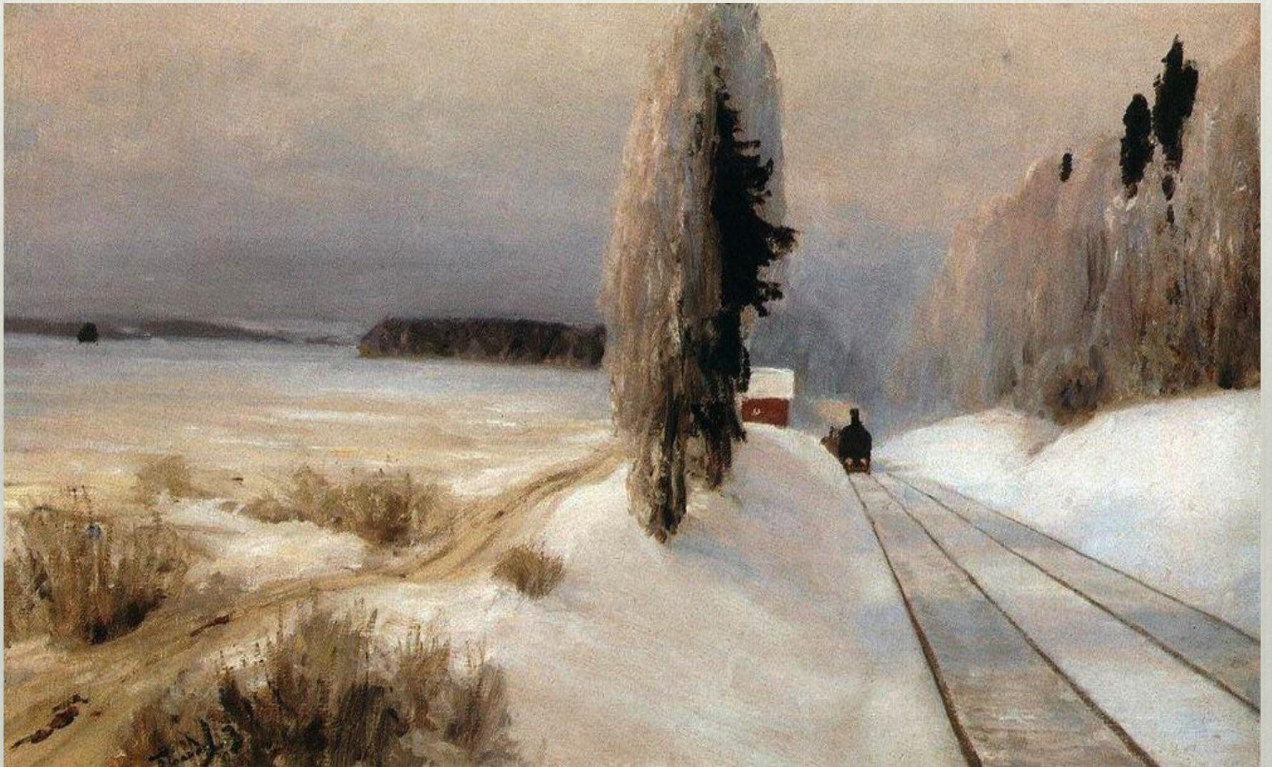
В.Поленов. Железная дорога близ станции Тарусская. 1903 г.