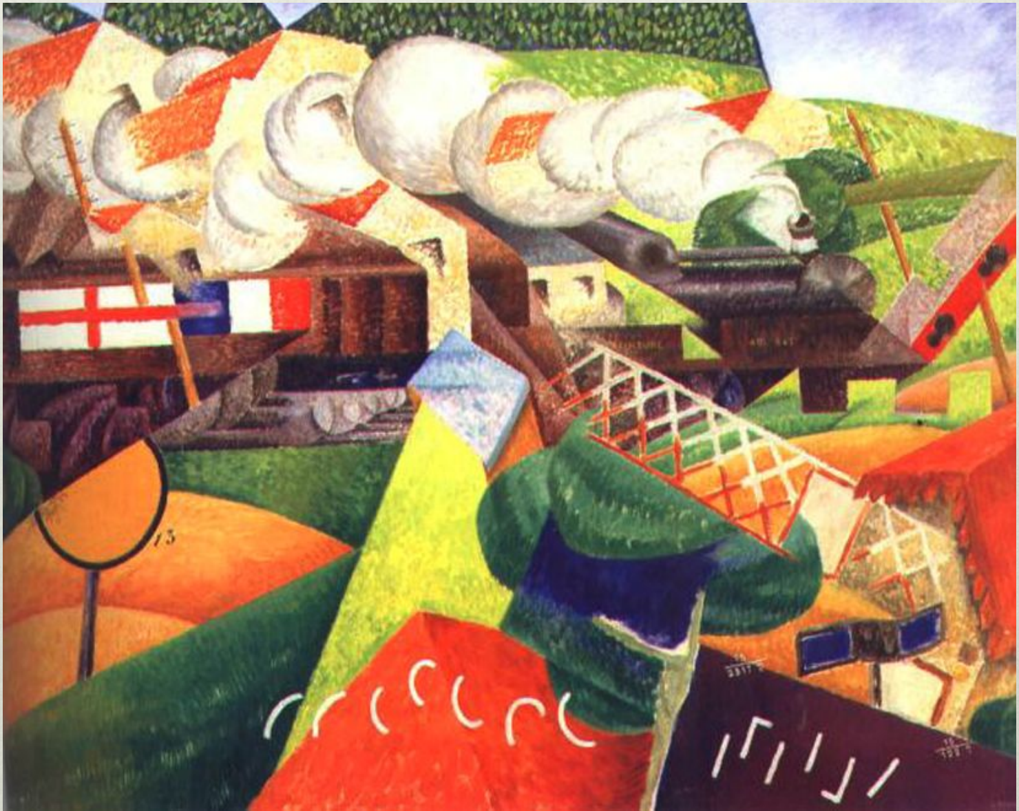
Дж.Северини. Поезд в красного креста, проходящий через деревню