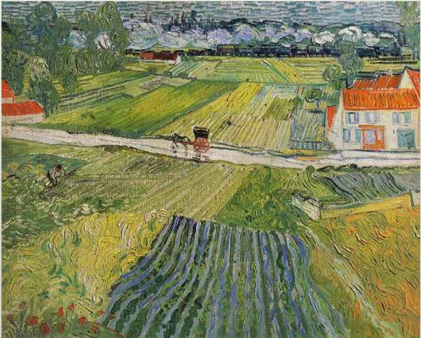
В. ван Гог. Пейзаж с тележкой и поездом. 1890