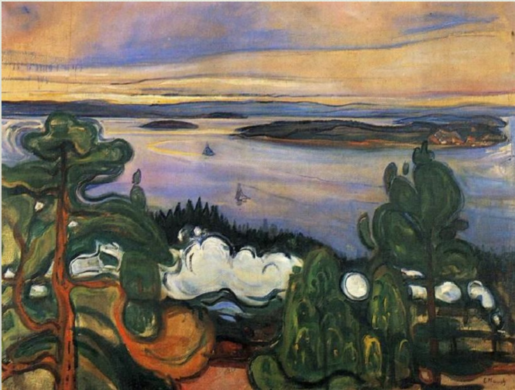
Э. Мунк. Паровозный дым. 1900 г.