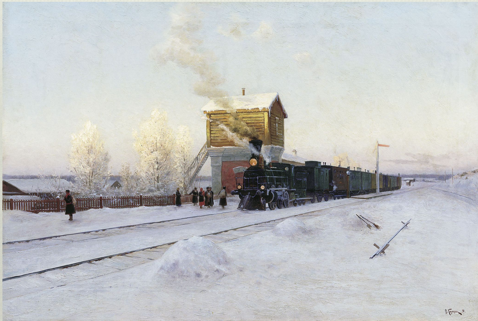
В.Казанцев. На полустанке. Зимнее утро на Уральской железной дороге. 1891 г.