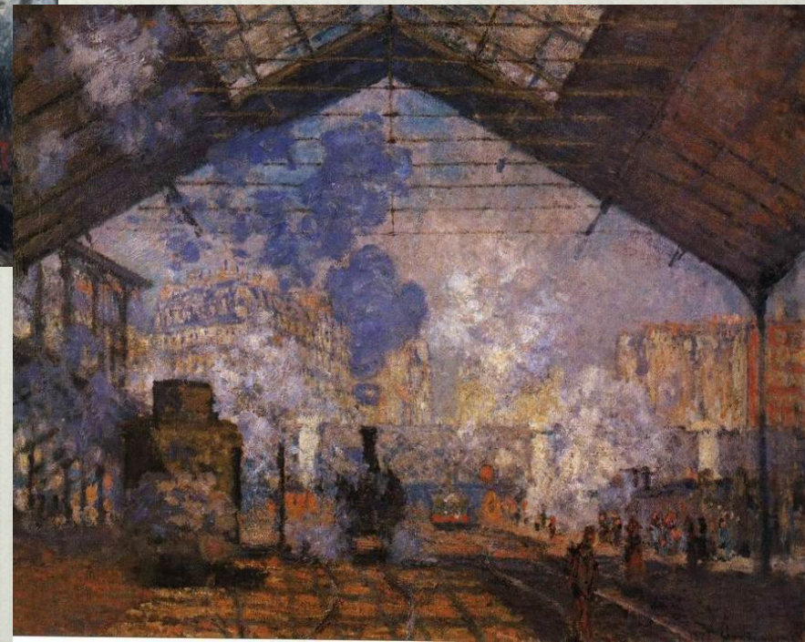
К.Моне. Вокзал Сент-Лазар в Париже. 1877 г.