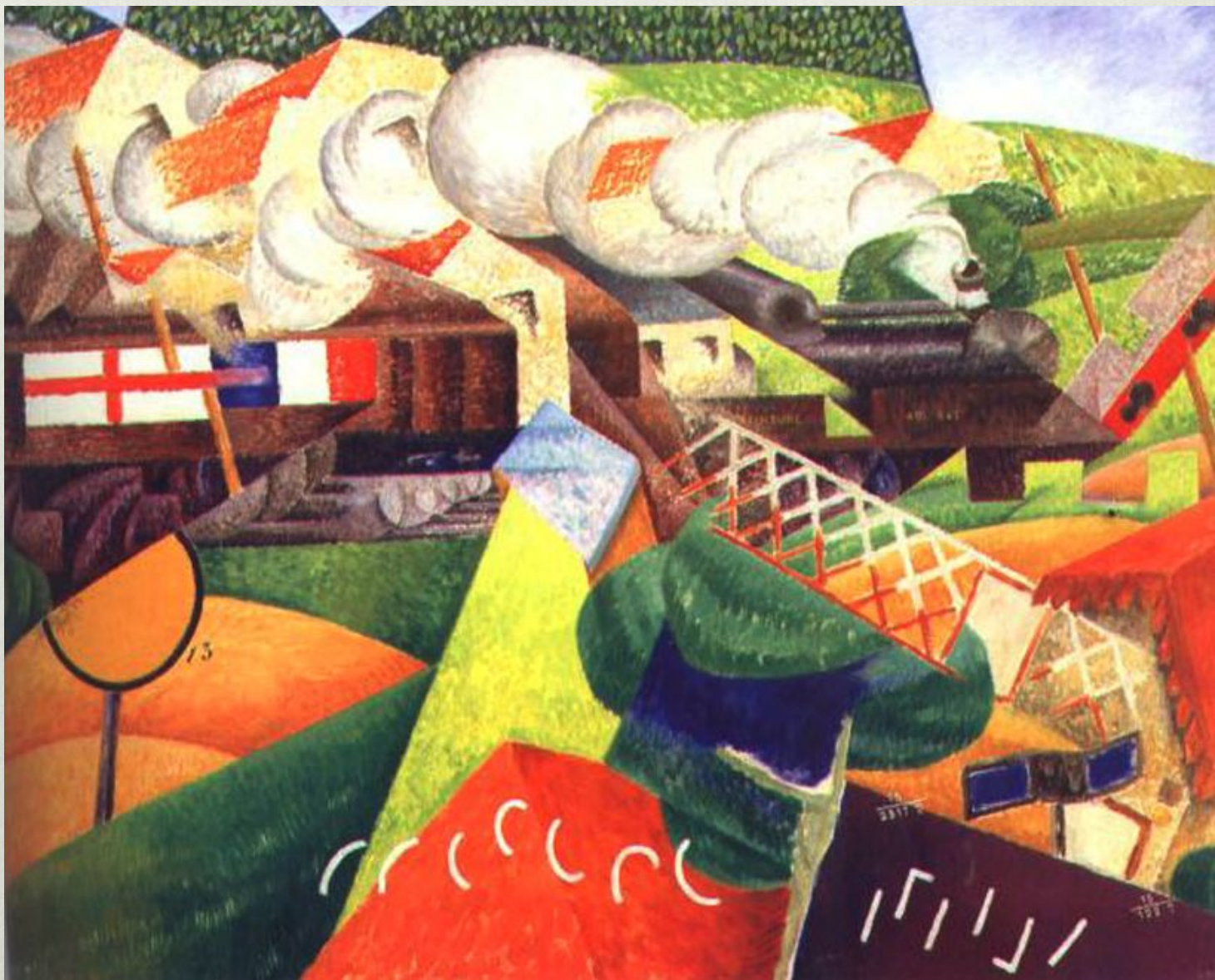
Дж.Северини. Поезд в красного креста, проходящий через деревню