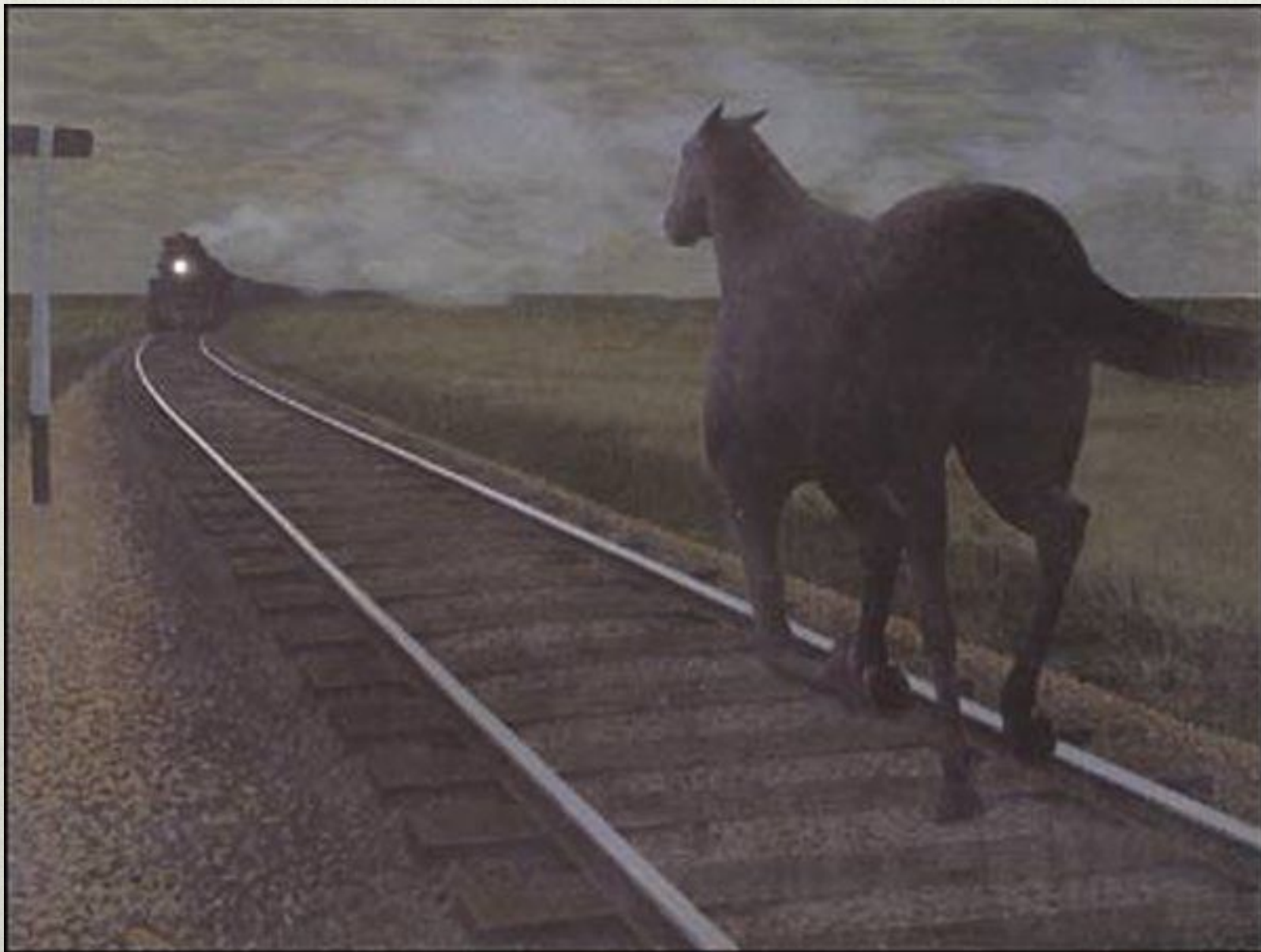
А. Колвиль. Лошадь и поезд