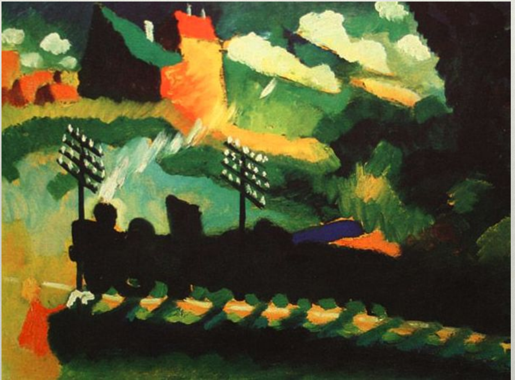
В.Кандинский. Поезд в Мурману. 1909 г.