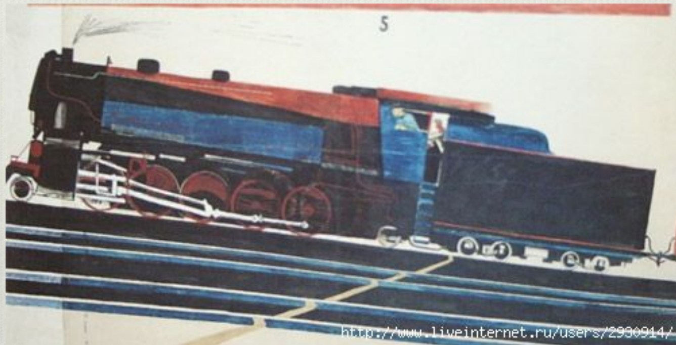
А.Дейнека. Паровоз. 1930-1931 г.