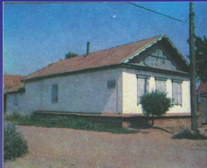
Оренбург. Слобода Берда. Дом И.Л.Бунтовой

Впечатления, почерпнутые при посещении пугачёвской резиденции, обогатили воображение поэта. Приметы обстановки, создающие реальность картин в «Капитанской дочке», были взяты Пушкиным во время знакомства с Бердами, Оренбургом и его окрестностями. ,без знания таких «примет» художник не чувствует себя свободным, рисуя картины жизни.