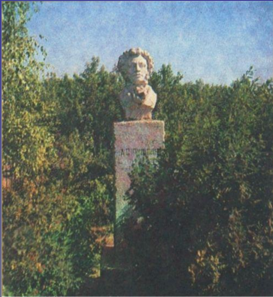
Татищев. Бюст А. С. Пушкина. Скульптор П. Г. Сурначев