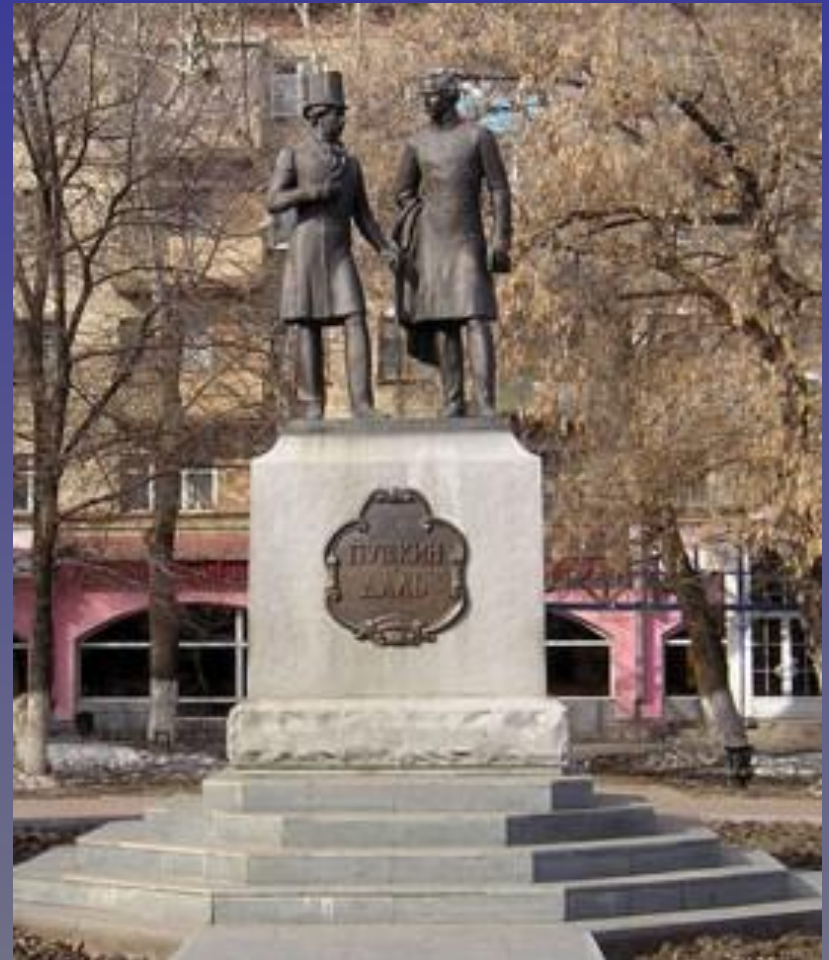
Памятник Пушкину, открыт в Оренбурге в 1977 г. На набережной Урала