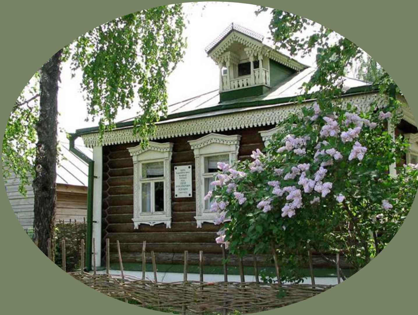
Дом-музей С.А. Есенина