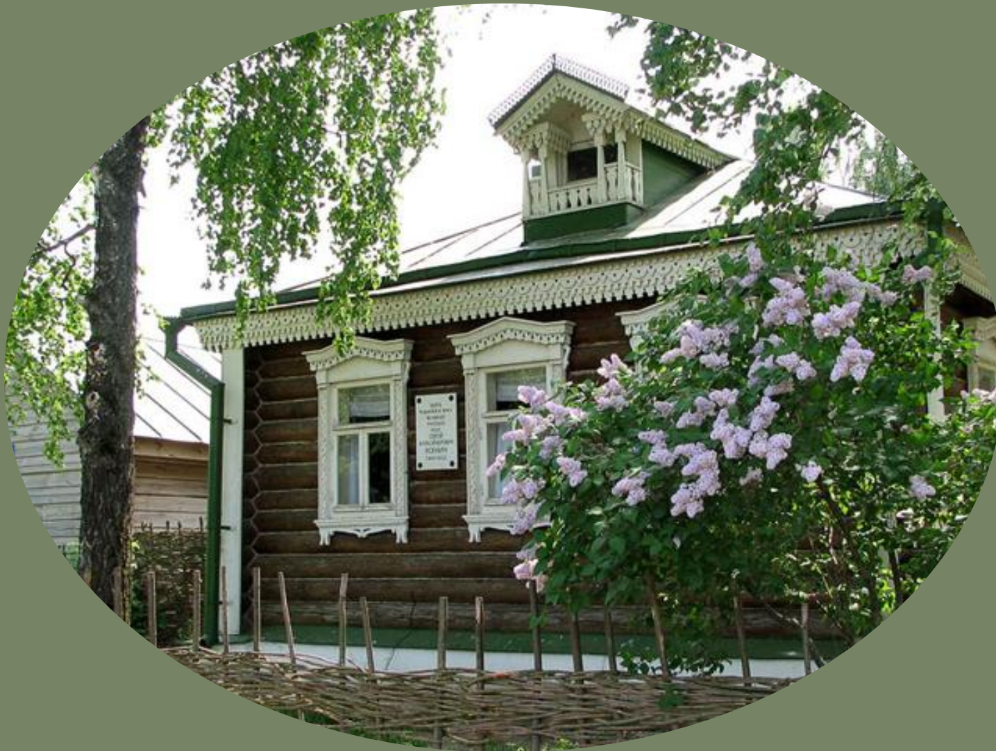
Дом-музей С.А. Есенина