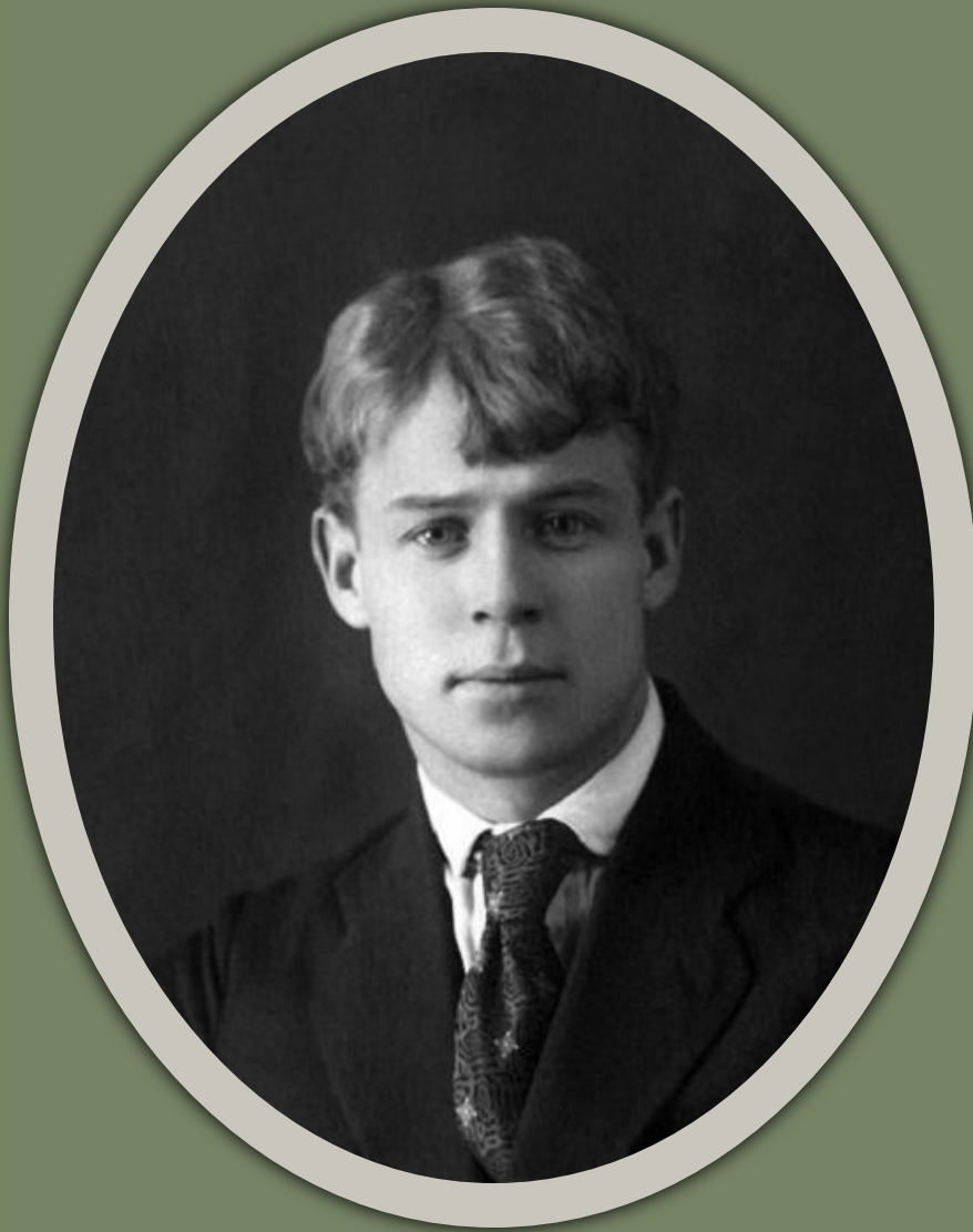
Сергей Александрович Есенин (1895-1925)