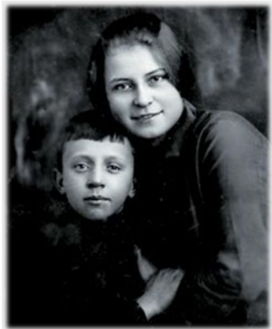
Анна Изряднова с сыном Юрием