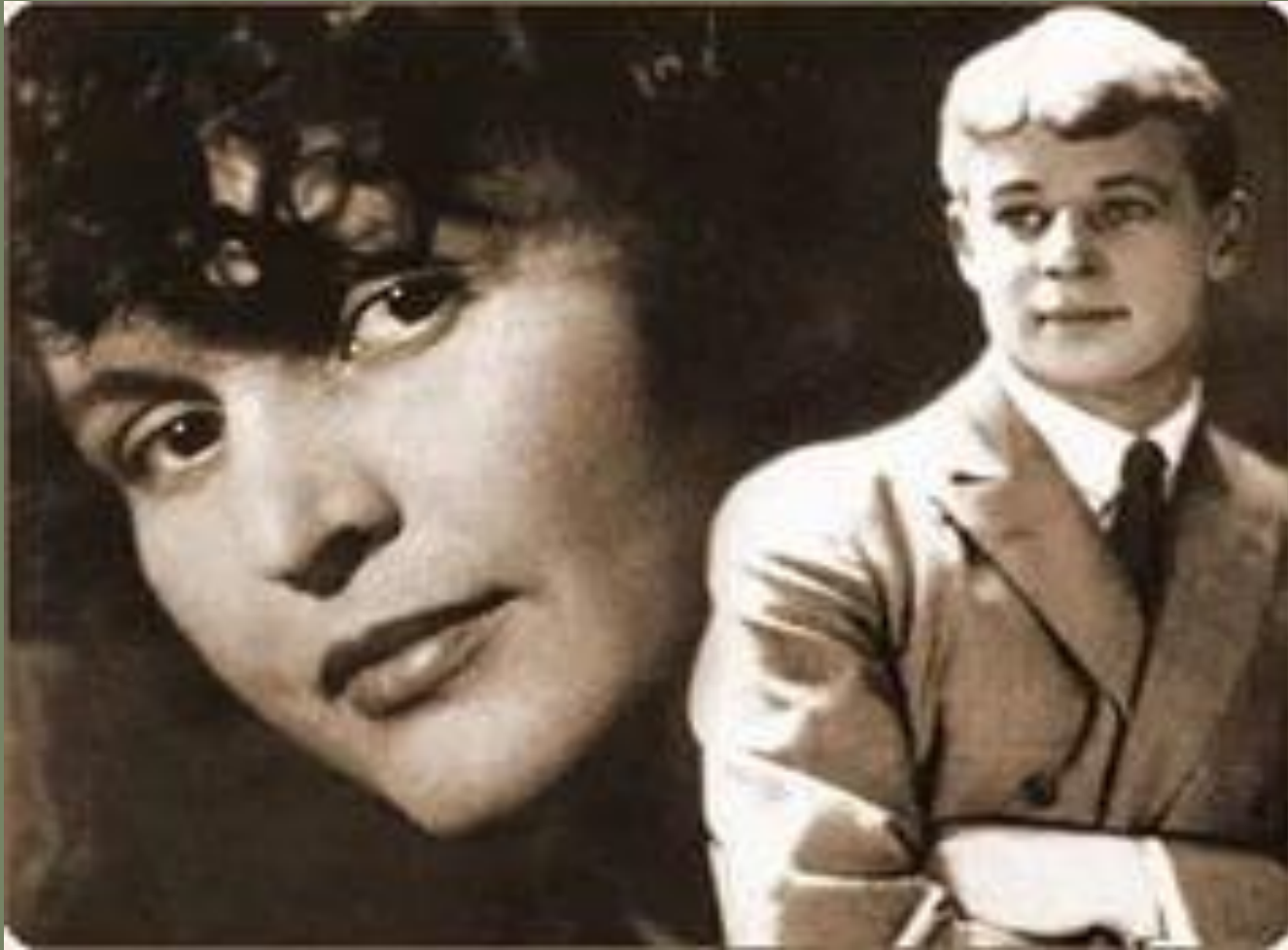
Сергей Есенин с Зинаидой Райх