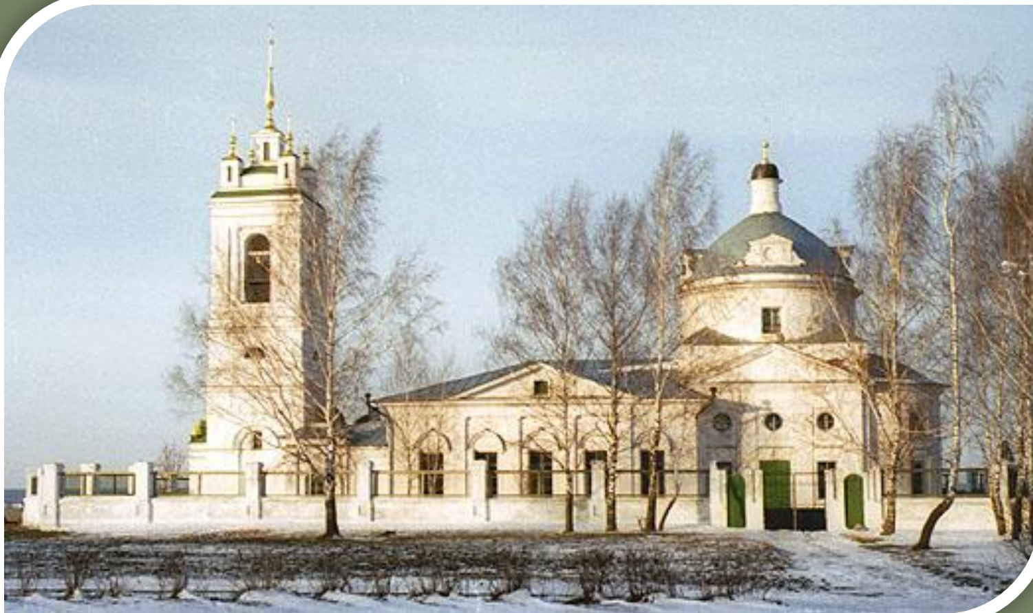
Церковь в селе Константиново