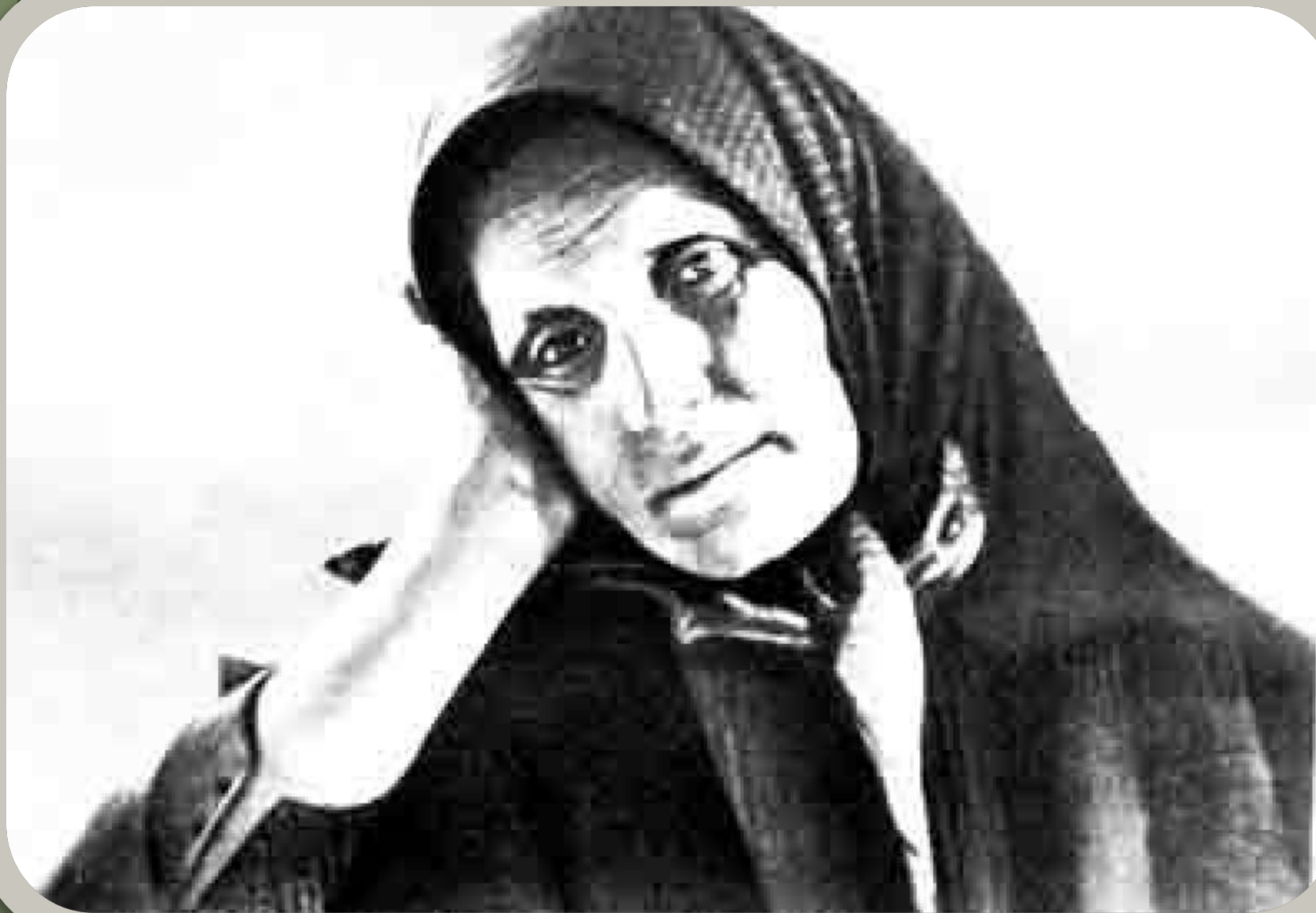
Мать Сергея Есенина