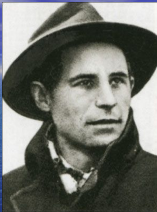
Н. М. Рубцов