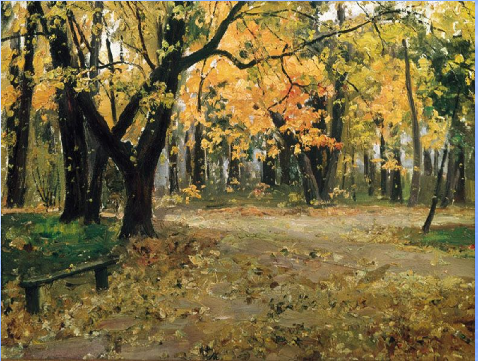
И. Остроухов. В Абрамцевском парке.