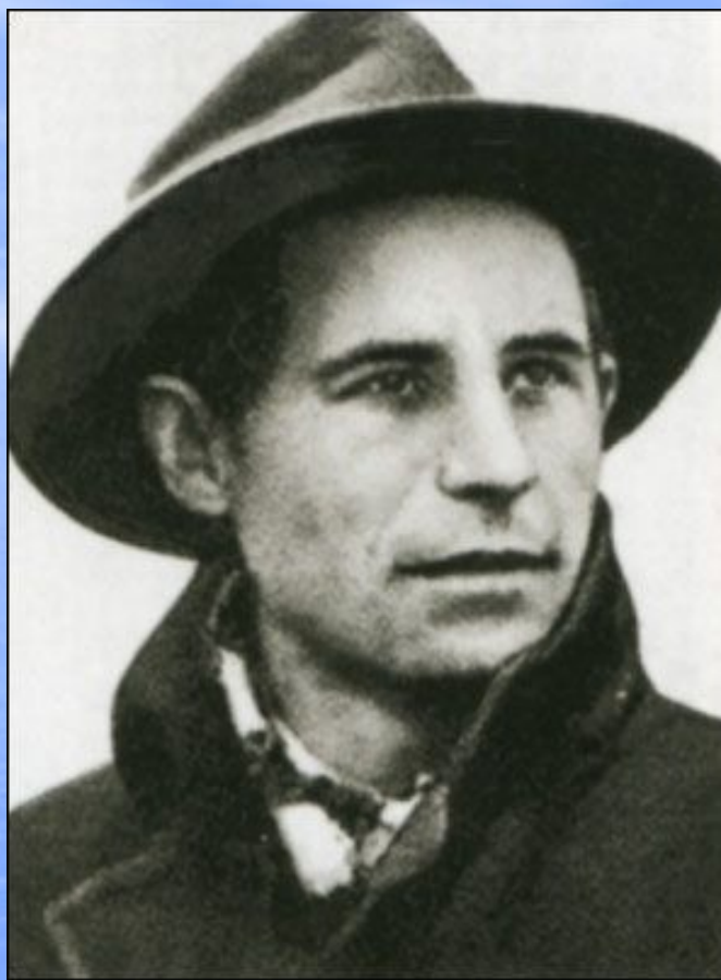
Н. М. Рубцов