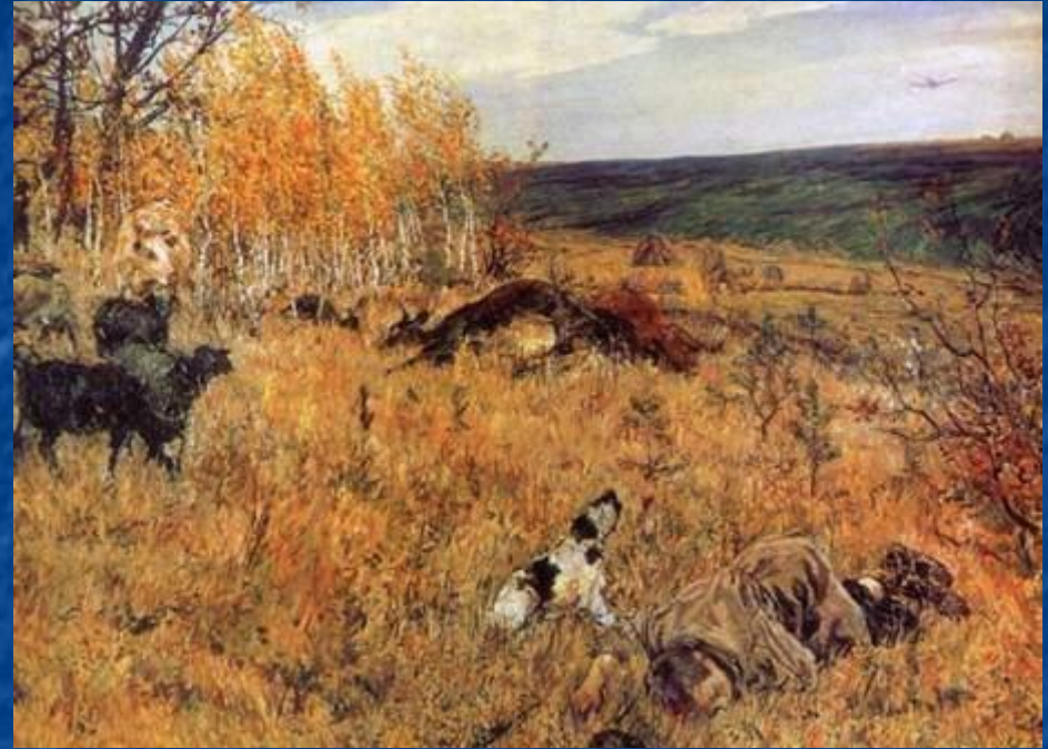
А. Пластов. Фашист пролетел. 1942

Быть может, самым страшным, что мог увидеть на войне взрослый человек: солдат, журналист, поэт — было то, что происходило с детьми. Дети не только становились сиротами. Они погибали, страдали в плену и оккупации, самоотверженно трудились в тылу, сражались с врагом в партизанских отрядах, были сыновьями и дочерьми полка в действующей армии. Часто дети становились героями произведений о войне.