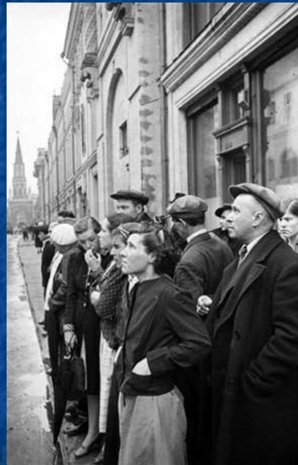
Москва. 22 июня 1941 г.

Бороться с врагом призывали поэтесса Серебряного века Анна Ахматова и крестьянский сын Александр Твардовский.