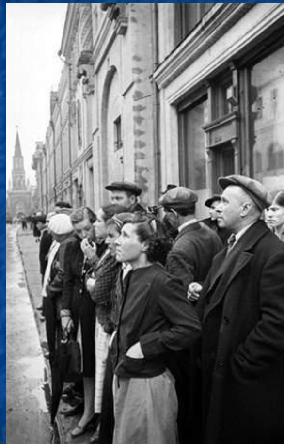
Москва. 22 июня 1941 г.

Бороться с врагом призывали поэтесса Серебряного века Анна Ахматова и крестьянский сын Александр Твардовский.