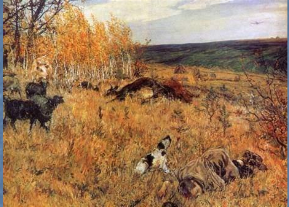
А. Пластов. Фашист пролетел. 1942

Быть может, самым страшным, что мог увидеть на войне взрослый человек: солдат, журналист, поэт — было то, что происходило с детьми. Дети не только становились сиротами. Они погибали, страдали в плену и оккупации, самоотверженно трудились в тылу, сражались с врагом в партизанских отрядах, были сыновьями и дочерьми полка в действующей армии. Часто дети становились героями произведений о войне.