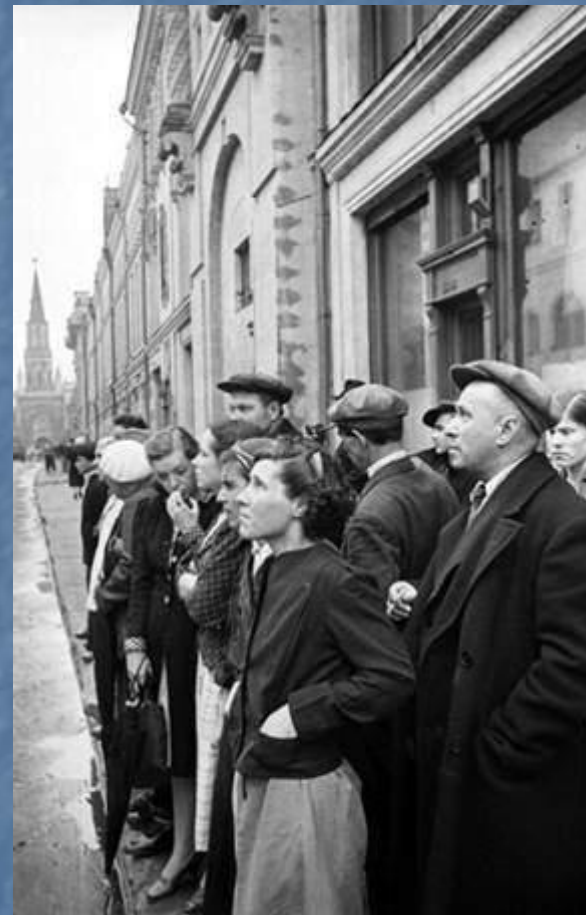
Москва. 22 июня 1941 г.

Бороться с врагом призывали поэтесса Серебряного века Анна Ахматова и крестьянский сын Александр Твардовский.