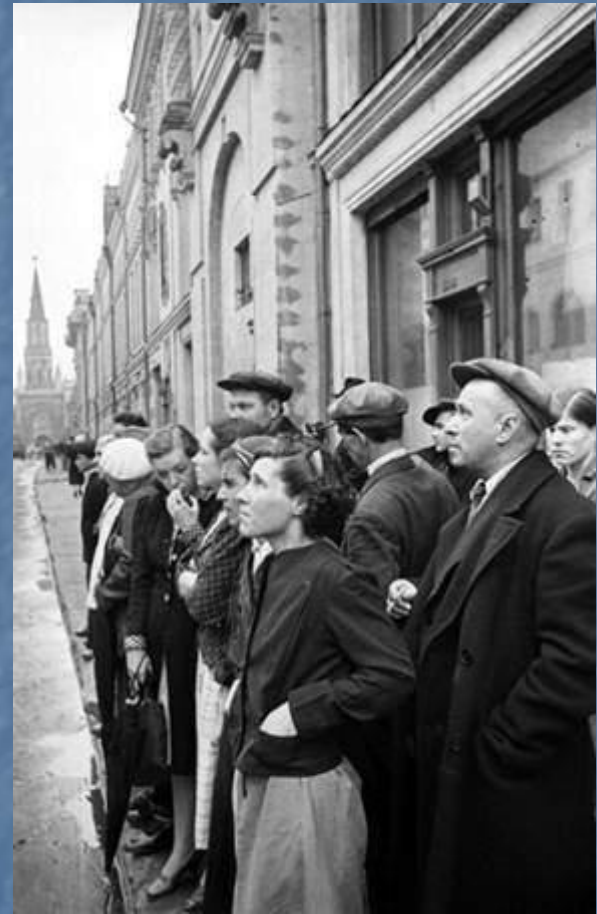
Москва. 22 июня 1941 г.

Бороться с врагом призывали поэтесса Серебряного века Анна Ахматова и крестьянский сын Александр Твардовский.