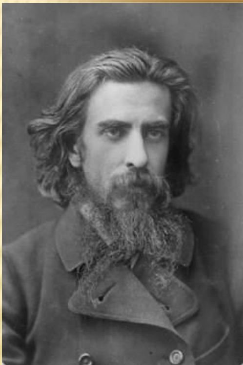
Владимир Сергеевич Соловьев (1853-1900)