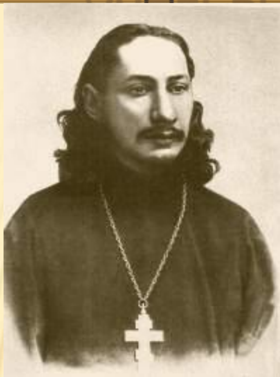
Павел Александрович Флоренский (1882-1937)