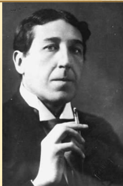
Игорь Васильевич Лотарев (1887-1941)