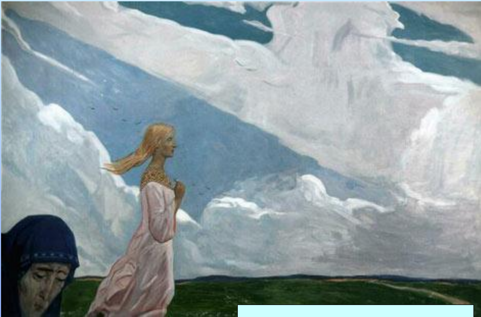
И.Глазунов. Русская песня.