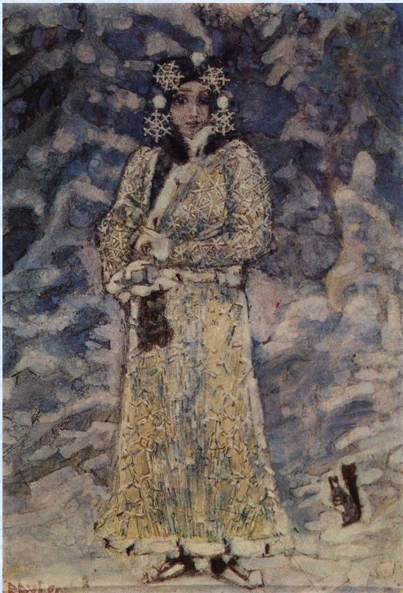
М. Врубель «Снегурочка»