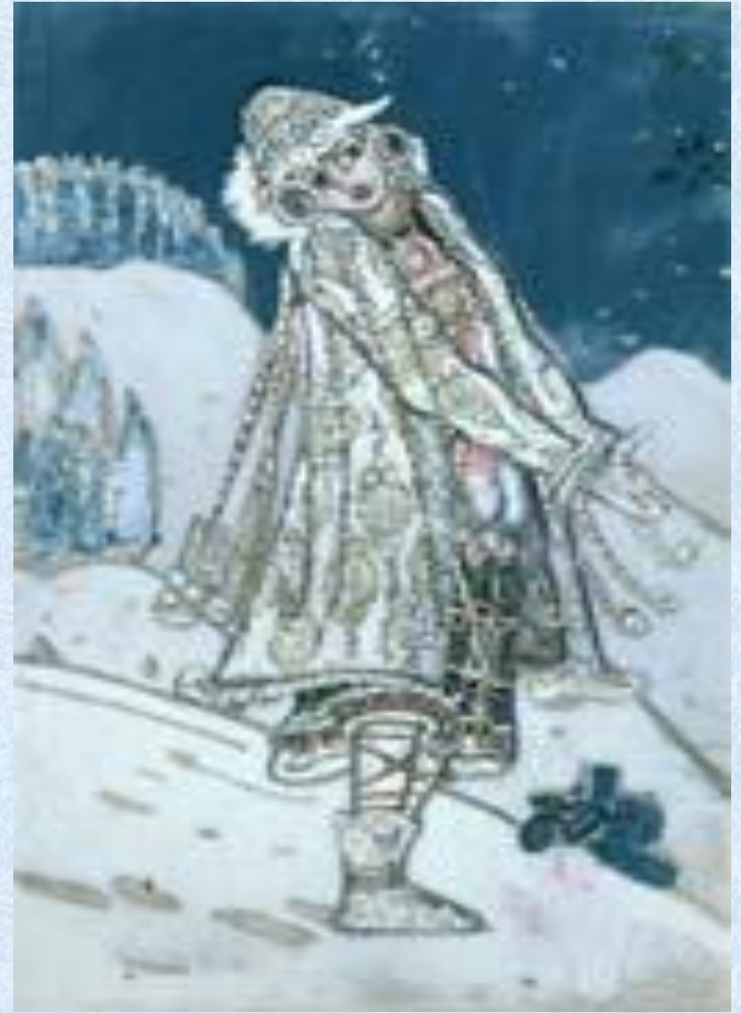
Н. Рерих «Снегурочка»