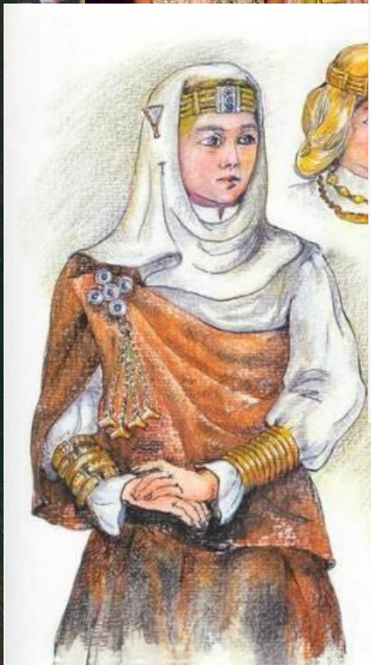
86 pav. Pietinės Lietuvos drabužių ir papuošalų ansamblis pagal Priešmančių tyrinėjimų duomenis. IX-X a.