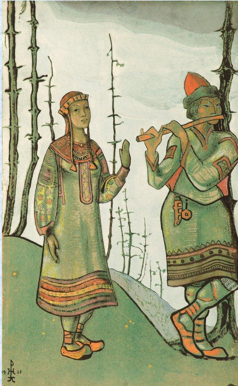
Н. Рерих «Лель и Снегурочка»