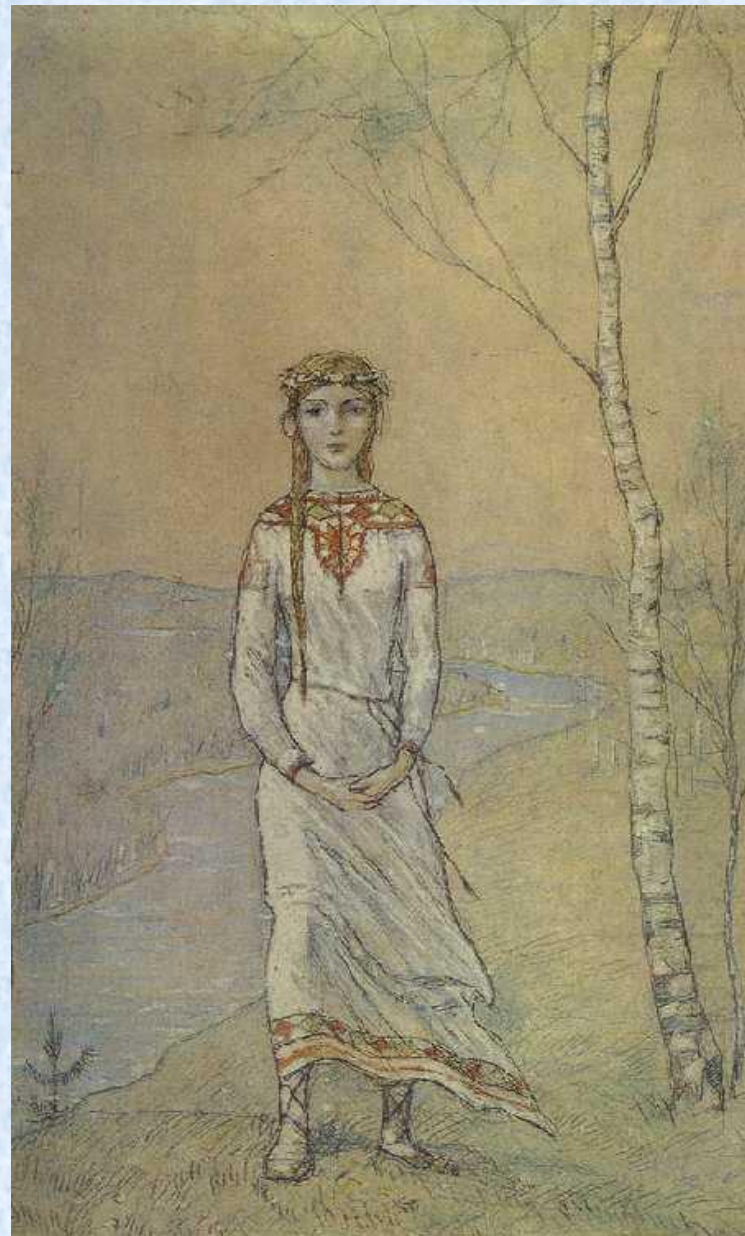
И. Глазунов «Снегурочка»