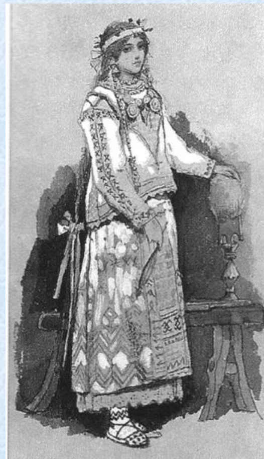
В. Васнецов костюм Снегурочки