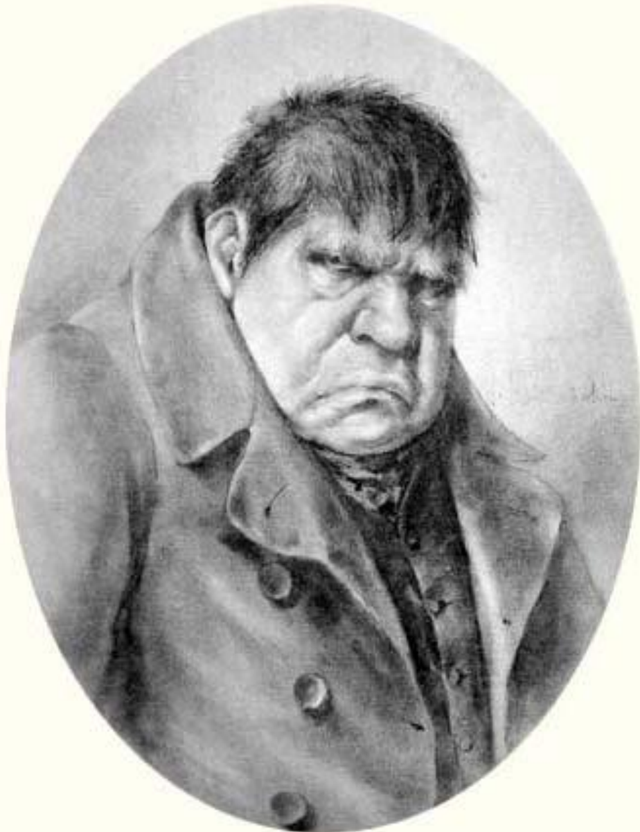
Михайло Семёнович Собакевич

В отличие от Ноздрева Собакевича нельзя причислить людям, витающим в облаках. Этот герой твёрдо стоит на земле, не тешит себя иллюзиями, трезво оценивает людей и жизнь, умеет действовать и добиваться того, чего хочет. Сам он отрицательно относится ко всему, что связано с культурой и просвещением: «Просвещение - вредная выдумка». Он хорошо понимает окружающую обстановку и понимает время, в которое он живёт, знает людей. В отличие от остальных помещиков он сразу понял сущность Чичикова. Собакевич - это хитрый пройдоха, наглый делец, которого трудно провести. Всё окружающее он оценивает лишь с точки зрения своей выгоды.