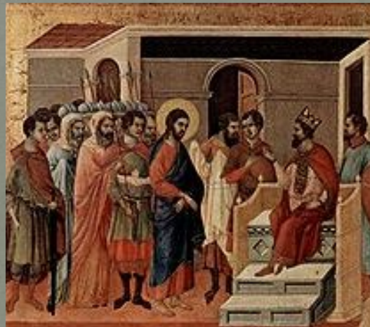
«Иисус облачается Иродом в белые одежды» (Дуччо, Маэста)