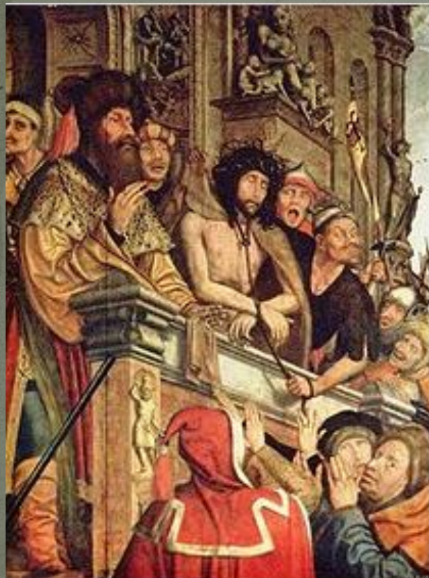
«Христос перед народом» (Квентин Массейс, ок. 1515 года)

Суд Пилата — описанный в Евангелиях суд над Иисусом Христом, которому Пилат, следуя требованиям народной толпы, вынес смертный приговор. Во время суда, согласно Евангелиям, Иисуса подвергли истязаниям (бичеванию, возложению тернового венца) — поэтому суд Пилата входит в число Страстей Христовых