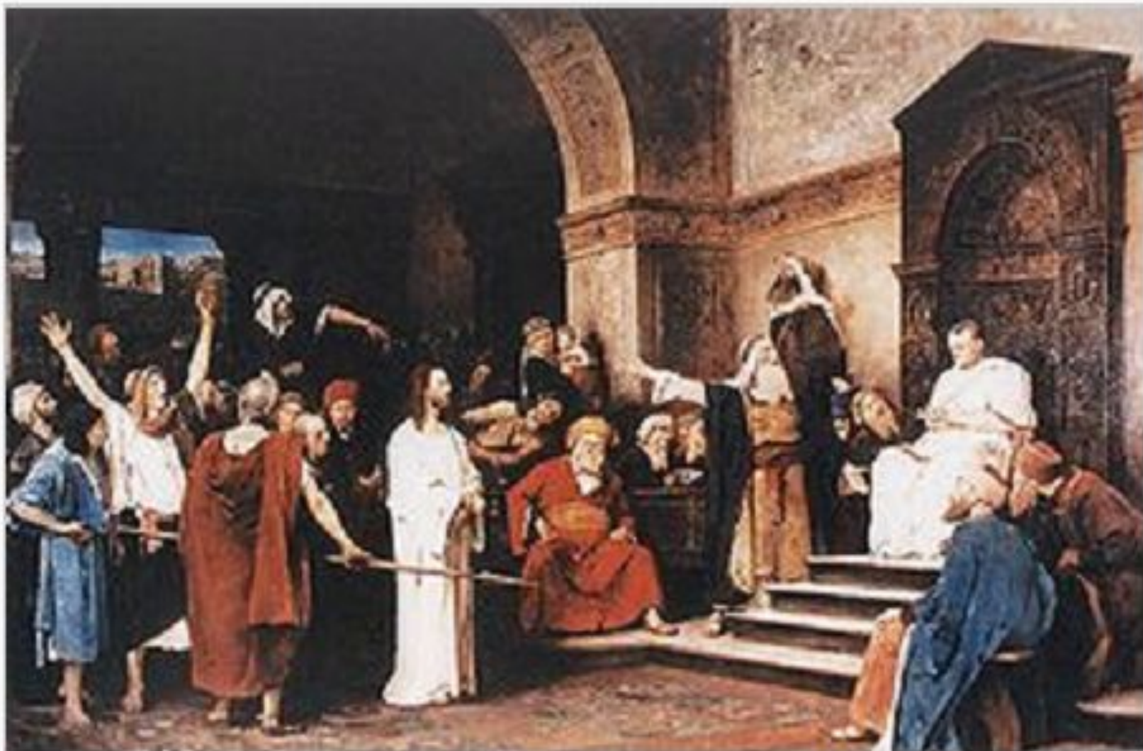
Христос перед Пилатом, Михай Мункачи, 1881 год