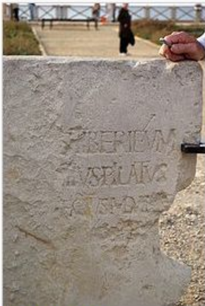
Плита из Кесарии