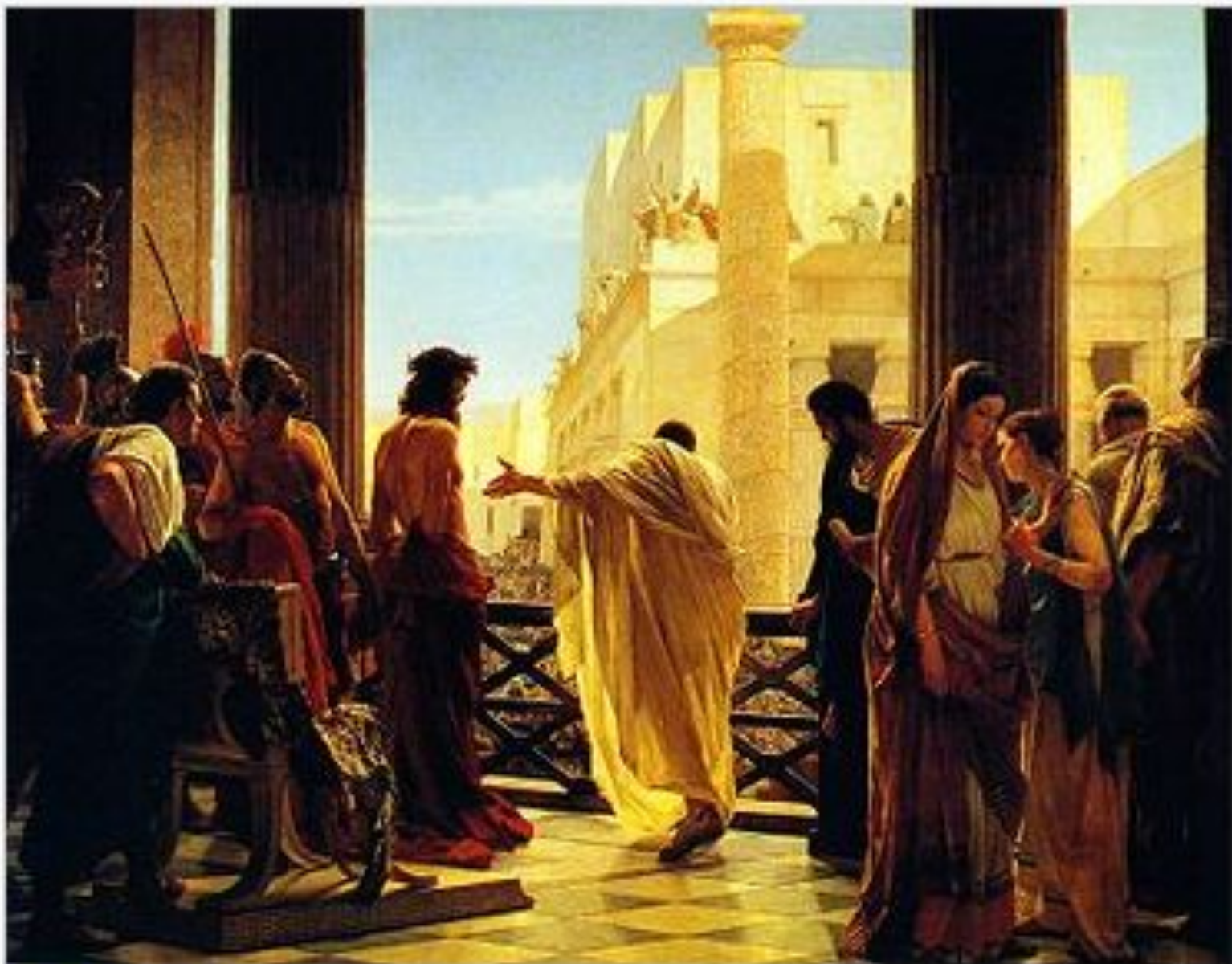
Ecce Homo (Се, Человек!) . На картине Антонио Чизери Понтий Пилат показывает подвергнувшегося бичеванию Иисуса жителям Иерусалима, в правом углу изображена скорбящая жена Пилата