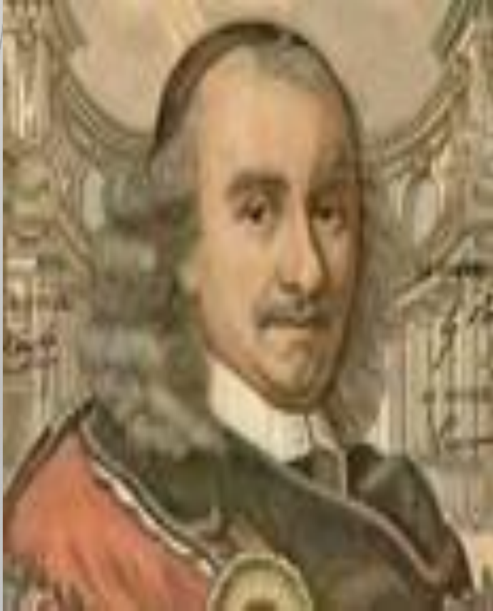
Пьер Корнель 1606 - 1684 г.- французский драматург.