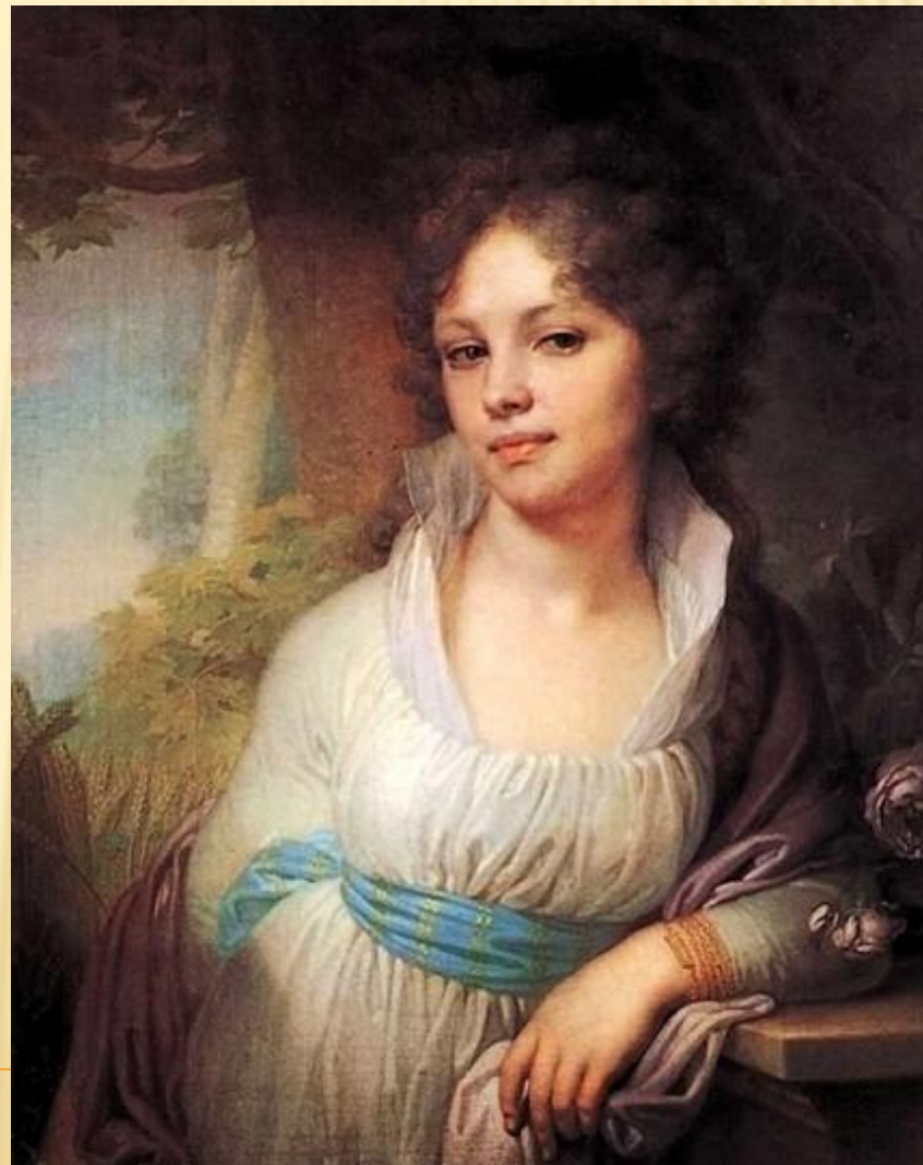
В.Л. Боровиковский. Портрет М.И.Лопухиной

ПРЕКРАСНА ТЫ В ВЛАСАХ СВОИХ, ХОТЬ ИХ НИКАК НЕ УБИРАЕШЬ, НО ТЫ НАРЯД ТАКОЙ ЛИШЬ ЛЮБИШЬ, В КОТОРОМ НЕЖНОСТЬ ПРОСТОТЫ БЛЕСТИТ ОТ СИЛЫ КРАСОТЫ Ф.ДМИТРИЕВ- МАМОНОВ