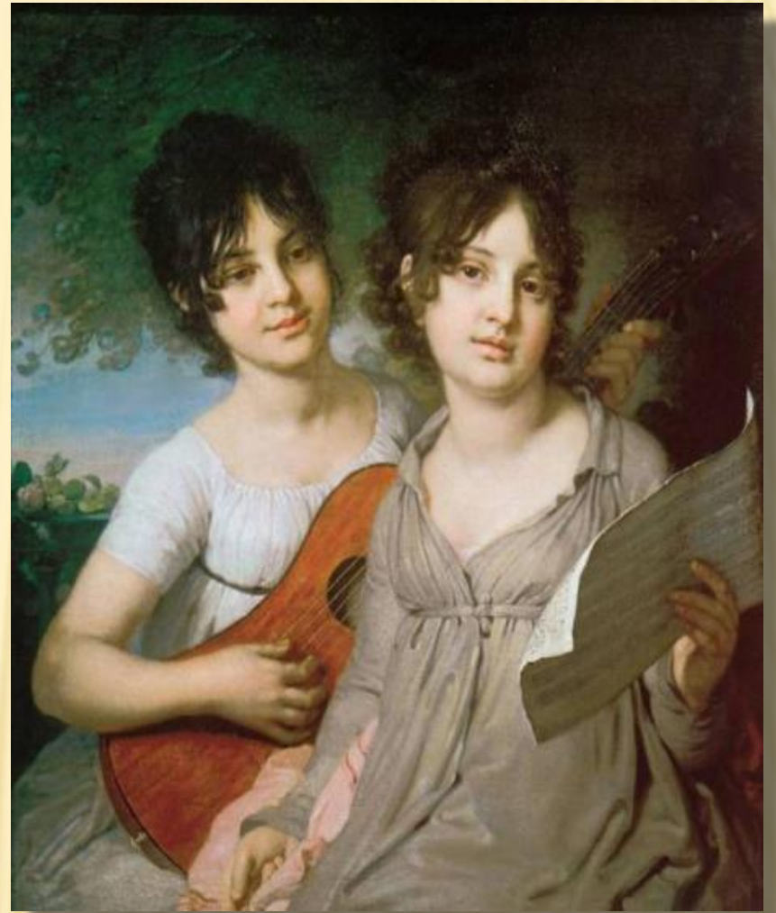
В. Л. БОРОВИКОВСКИЙ ПОРТРЕТ А. Г. И В. Г. ГАГАРИНЫХ. 1802 Г.

Сентиментализм – художественное течение в искусстве и литературе второй половины XVIII – начала XIX веков.