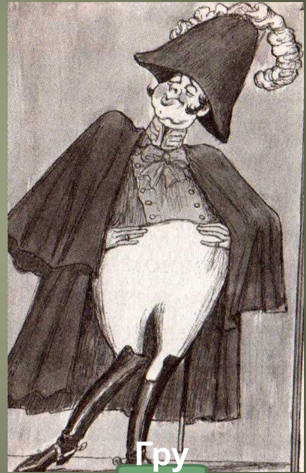
Гру СТИ ЛОВ