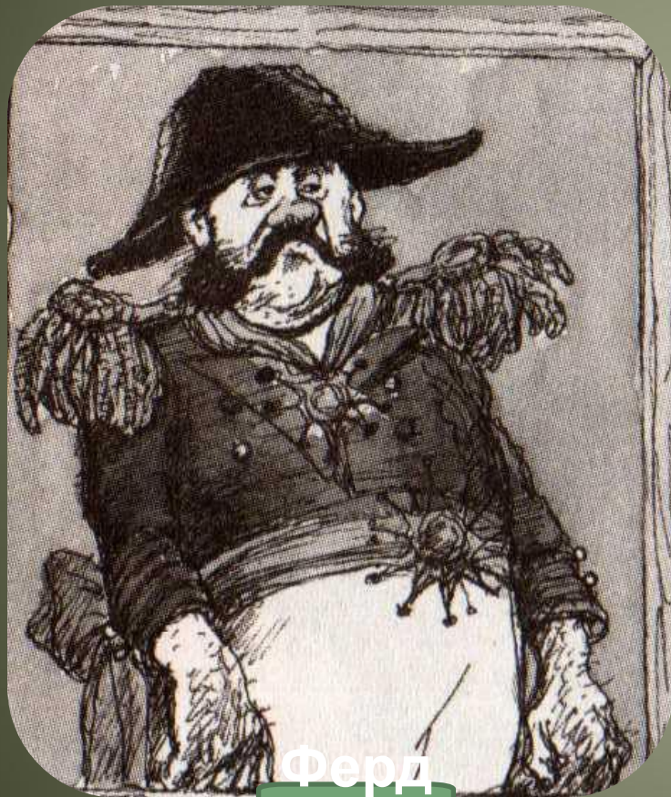
Ферд ыще нко