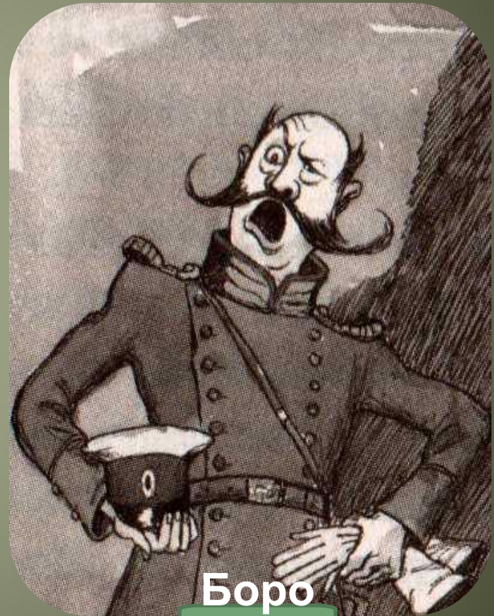
Боро давк ин