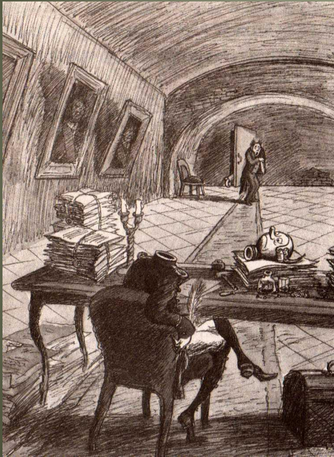
Кукрыниксы. «Органчик- Брудастый и письмоводитель в кабинете»