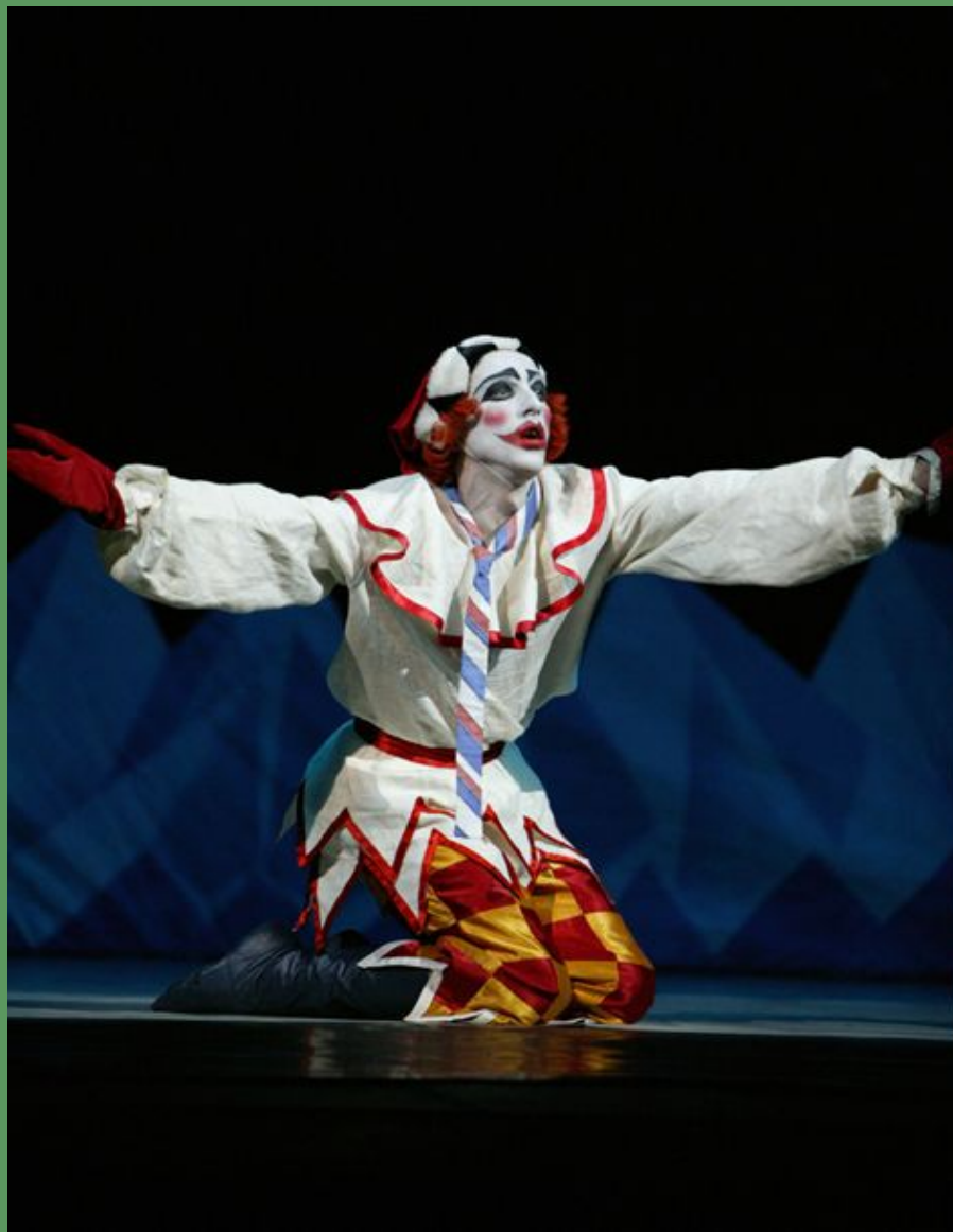
И.Стравинский балет «Петрушка»