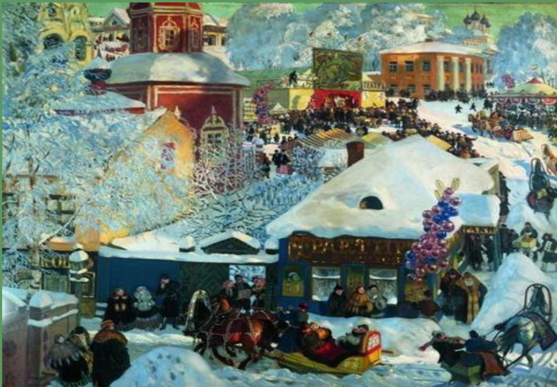
Б.Кустодиев. Масленичное гулянье. 1919 г.