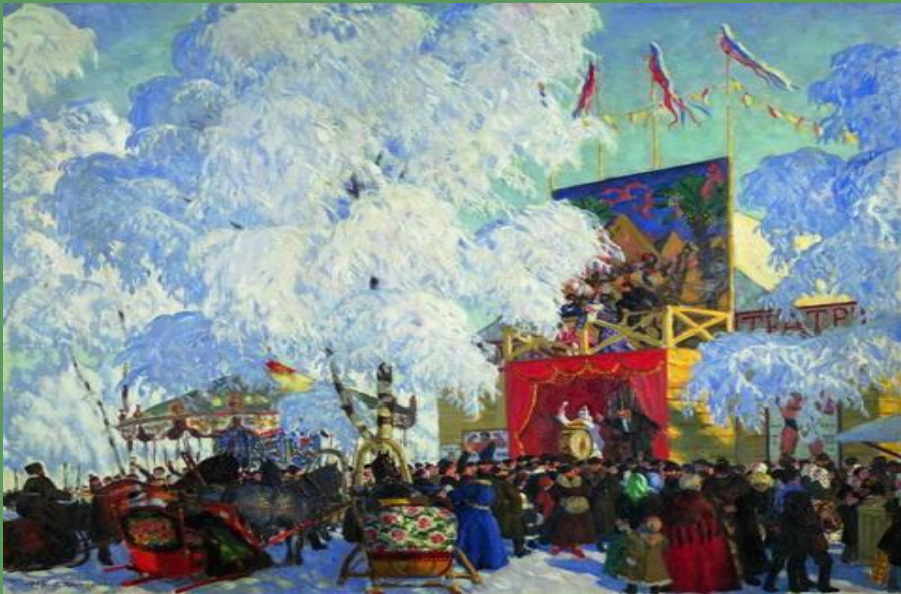
Б.Кустодиев. Балаганы. 1917 г.