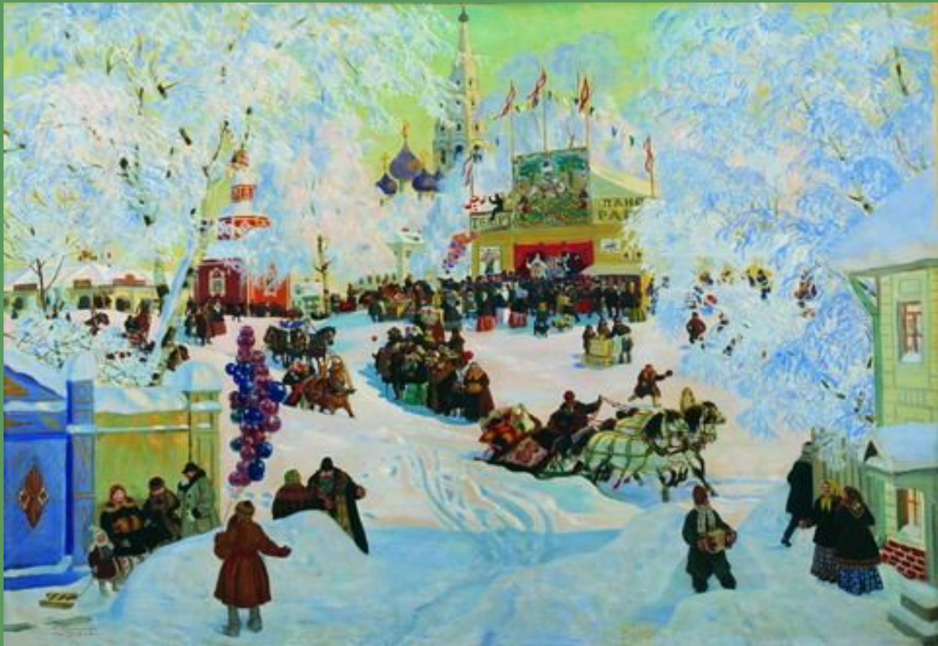
Б.Кустодиев. Масленица. 1919 г.