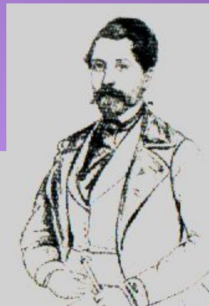
Жорж Дантес- Геккерн