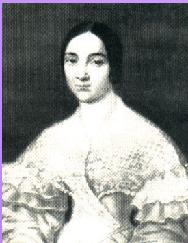
Екатерина Николаевна Дантес- Геккерн