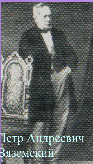
Петр Андреевич Вяземский