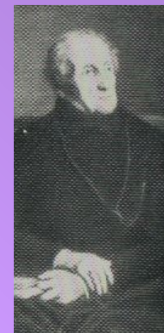
Софья Ивановна и Ксавье де Местр

С.И. Местр и ее муж граф Ксавье де Местр, человек талантливый и образованный, знакомый с семьей Пушкиных еще во времена детства поэта.