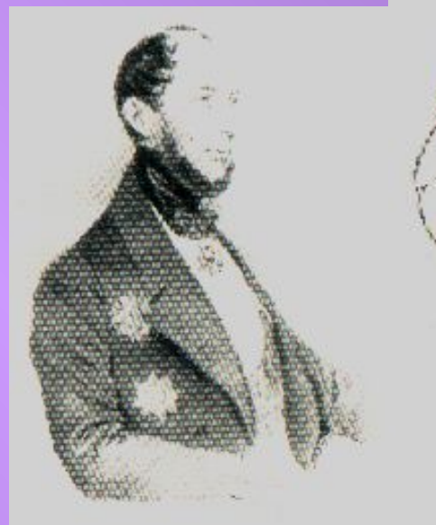
Луи Борхард де Боверваард Геккерн