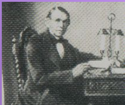
Петр Александрович Плетнев