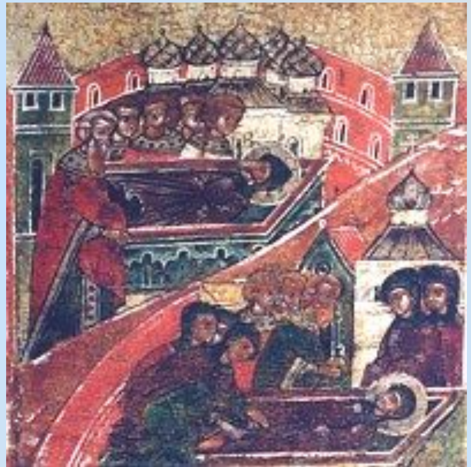
Разнесение тел Петра и Февронии по отдельным гробам.