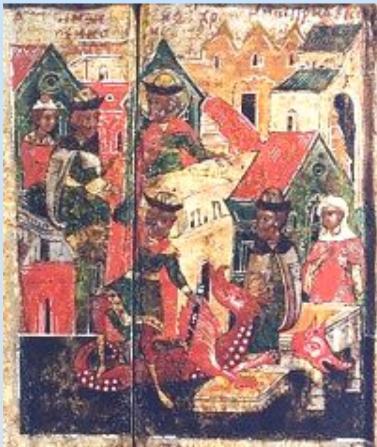
Князь Петр убивает змея.

Князь Петр на одре болезни. Предстоящие рассказывают ему о Рязанской земле, славящейся своими врачами.