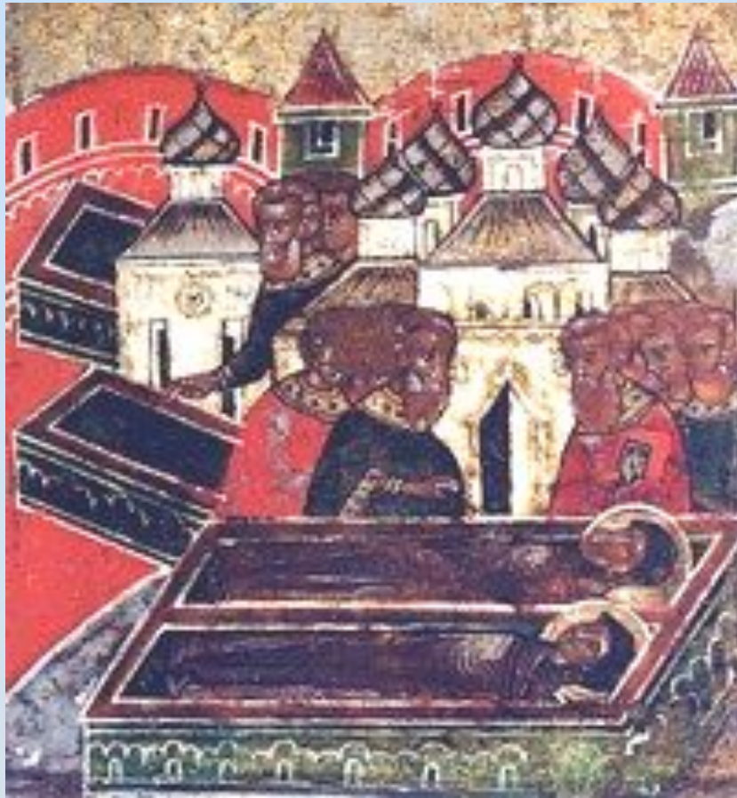
Обретение тел Петра и Февронии в едином гробе.