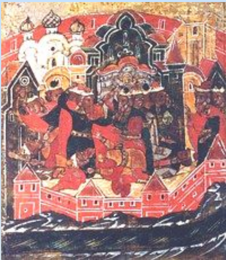
Междоусобица в Муроме.

Бояре призывают Петра и Февронию вернуться на княжение.