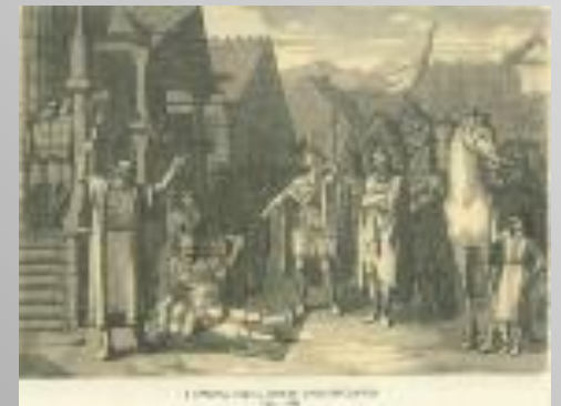
Смерть князя Олега