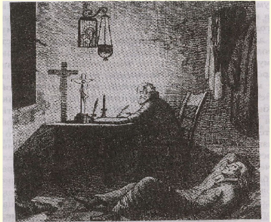
«Борис Годунов». Гравюра С. Галактионова.